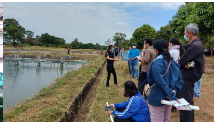
จดหมายข่าว หน้า 4