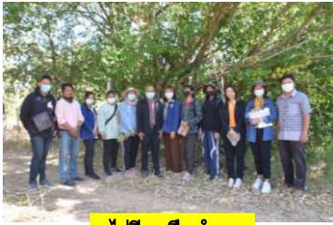
ต.ไร่สี อ.ลืออำนาจ