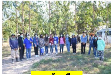
ต.นาแต่ อ.เมืองฯ