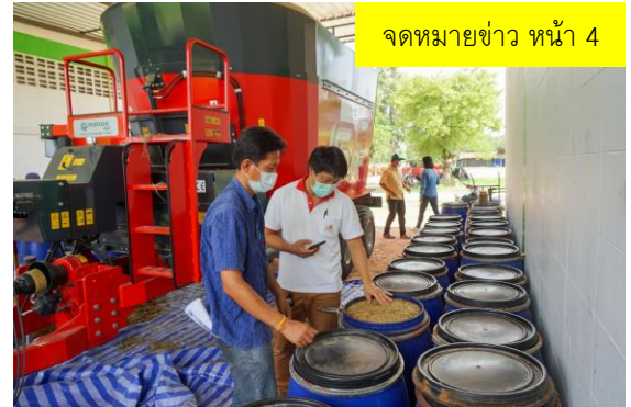
จดหมายข่าว หน้า 4

วันที่ 7 พฤษภาคม 2564 ศูนย์วิจัยและพัฒนาอาหารสัตว์อำนาจเจริญ ร่วมประชุมหารือกับบริษัทอุบลพลังงาน เพื่อขับเคลื่อนโครงการส่งเสริมและพัฒนาโคพรีเมียมตามระบบการส่งเสริมแบบอุบลโมเดล (CO-UBONMODEL) ในด้านการจัดการฟีดอาหารสัตว์และการผลิตอาหารครบส่วน (TMR) เพื่อลดต้นทุนการเลี้ยงสัตว์ของเกษตรกรกลุ่มอำเภอนำร่องของโครงการ รวม 4 อำเภอ ได้แก่ อำเภอนาเยีย วารินชำราบ สว่างวีระวงศ์ และอำเภอพิบูลมังสาหาร ในพื้นที่จังหวัดอุบลราชธานี ต่อไป พร้อมได้นำคณะทำงานของบริษัทอุบลพลังงานศึกษาดูงานการจัดการแปลงหญ้าแพงไกล่ การใช้เลี้ยงโคเนื้อด้วยอาหารครบส่วน (TMR) และการผลิตอาหาร TMR เพื่อเป็นแนวทางสำหรับการผลิตจำหน่ายให้เกษตรกรต่อไป