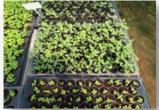
- การเตรียมแปลงปลูก พร้อมย้ายปลูกลงแปลง