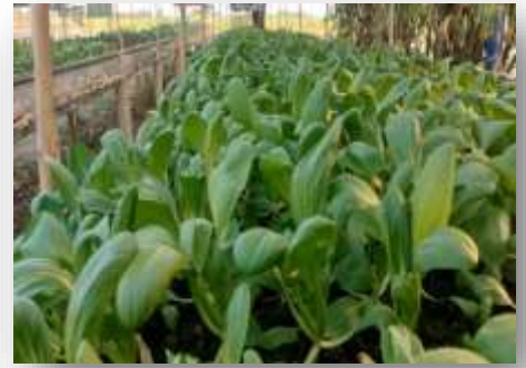
- กวางตุ้ง