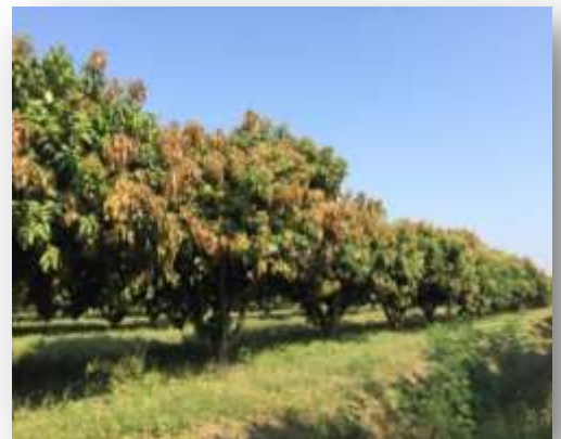
มะม่วงน้ำดอกไม้สีทอง