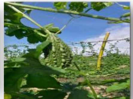
- มะระขึ้นก