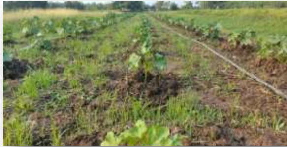
- กระเจี๊ยบเขียว