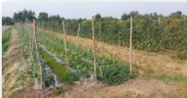
- ถั่วฝักยาว