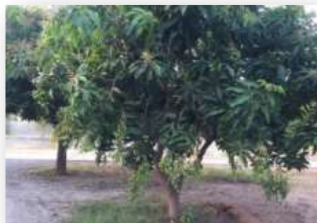
มะม่วงเบา