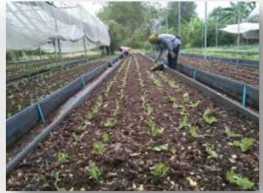
- ดูแลแผนแดงพร้อมเก็บตากแดดไว้สำหรับผสมดินเพาะกล้า