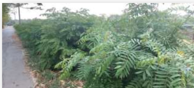
- ขี้เหล็ก