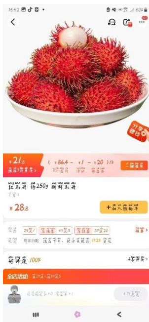
เงาะไหหลำ