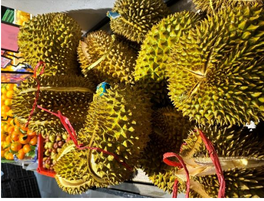
ทุเรียนหมอนทอง (ไทย)