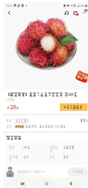
เงาะเวียดนาม