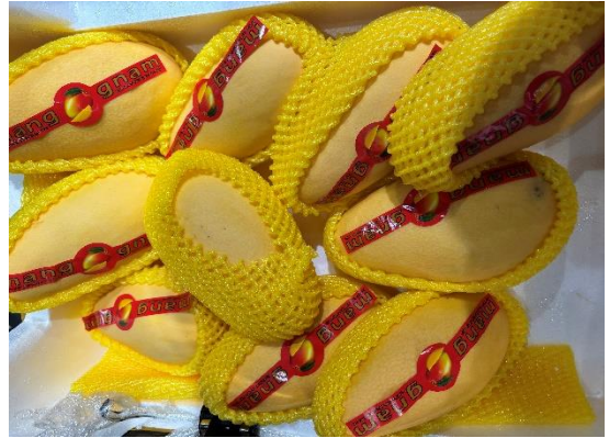
มะม่วง (จีน)