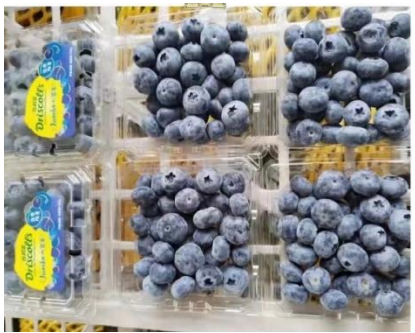
บลูเบอร์รี่ (หยุนหนาน)