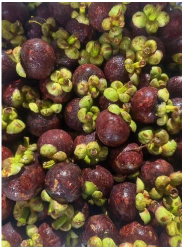
มังคุด (ไทย)