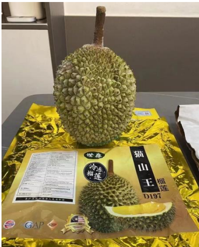
ทุเรียนแช่แข็งมุซังคิงส์ (มาเลเซีย)