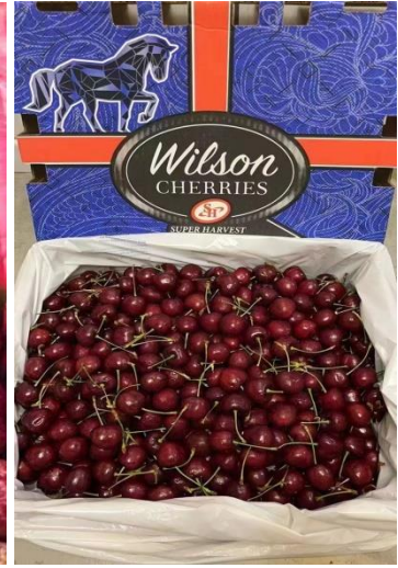
เชอร์รี่(ชิลี)