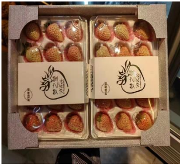
สตอเบอร์รี่ (จีน)