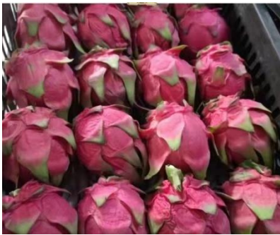
แก้วมังกร (ไทหล่า)