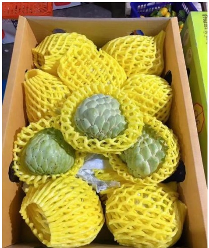
น้อยหน่า (ไทย)