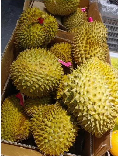
ทุเรียนหมอนทอง (ไทย)