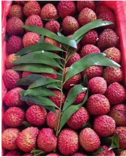
ลิ้นจี่(จีน)