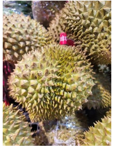
ทุเรียนก้านยาว (เวียดนาม)