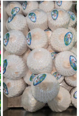
มะพร้าวสด (ไทย)