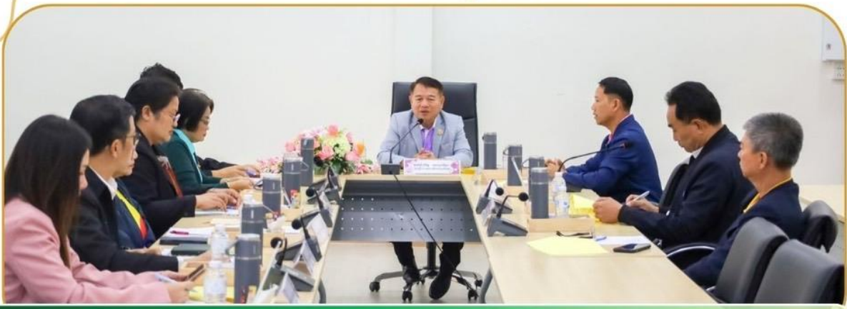
ภาพกิจกรรม 26 ธันวาคม 2567 ณ ห้องประชุมประเสริฐ บุญเรือง