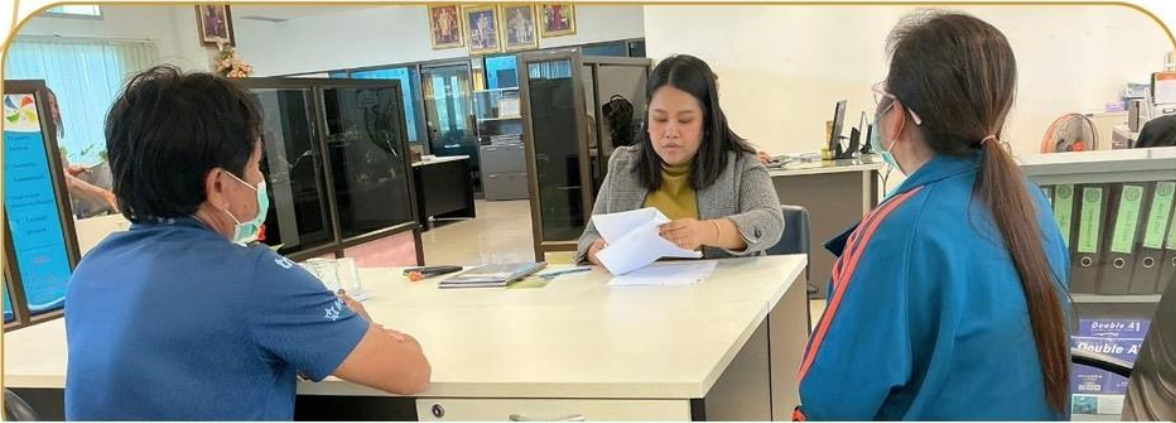
ภาพกิจกรรม 17 ธันวาคม 2567 ณ สำนักงานเกษตรและสหกรณ์จังหวัดบุรีรัมย์

เจ้าหน้าที่ฯ ชี้แจงโครงการกองทุนหมุนเวียนเพื่อการกู้ยืม แก่เกษตรกรและผู้ยากจน แก่เกษตรกรอำเภอบ้านใหม่ไชยพจน์