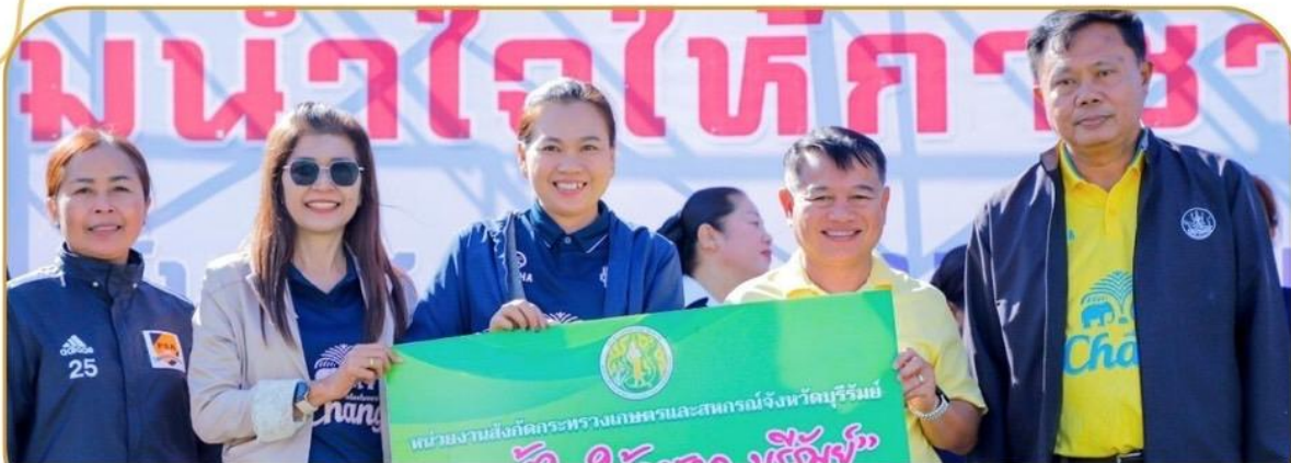
ภาพกิจกรรม 18 ธันวาคม 2567 ณ กองร้อยอาสาสมัครชาตินิคมแดนจังหวัดบุรีรัมย์