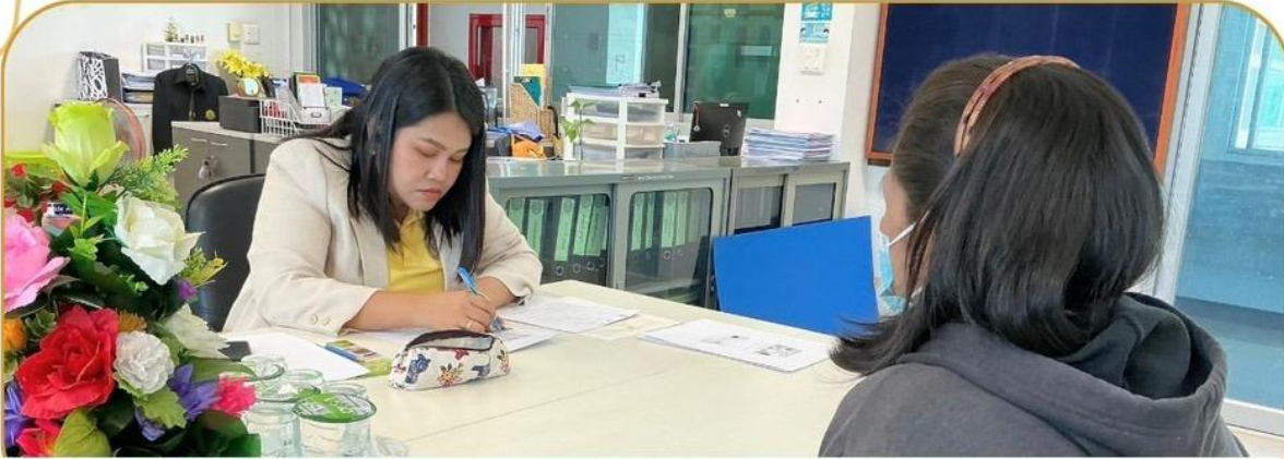
ภาพกิจกรรม 16 ธันวาคม 2567 ณ สำนักงานเกษตรและสหกรณ์จังหวัดบุรีรัมย์

เจ้าหน้าที่ฯ ชี้แจงโครงการกองทุนหมุนเวียนเพื่อการกู้ยืม แก่เกษตรกรและผู้ยากจน แก่เกษตรกรอำเภอกระสัง