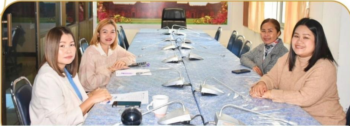
ภาพกิจกรรม 20 ธันวาคม 2567 ณ สำนักงานเกษตรและสหกรณ์จังหวัดบุรีรัมย์