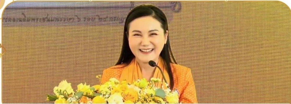
ภาพกิจกรรม 6 ธันวาคม 2567 ณ อำเภอนางรอง

ร่วมเปิดโครงการเสริมสร้างวินัยทางการเงินภาคครัวเรือน จับเคลื่อนชุมชนเข้มแข็งฯ (กิจกรรมเปิดกระปุกออมสิน)