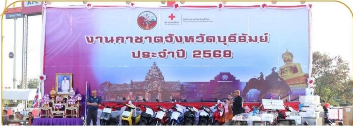
ภาพกิจกรรม 24 ธันวาคม 2567 ณ สนามช้างอารีนา