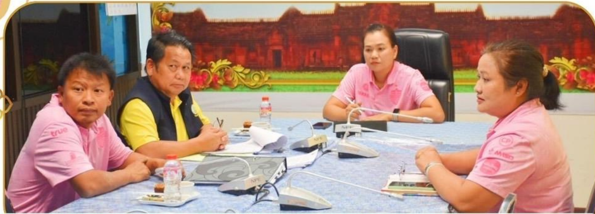
ภาพกิจกรรม 11 ธันวาคม 2567 ณ สำนักงานเกษตรและสหกรณ์จังหวัดบุรีรัมย์

หารือแก้ไขปัญหาลงของสมาชิกเกษตรภาคอีสาน และสมาพันธ์เกษตรกรอีสาน ครั้งที่ 1