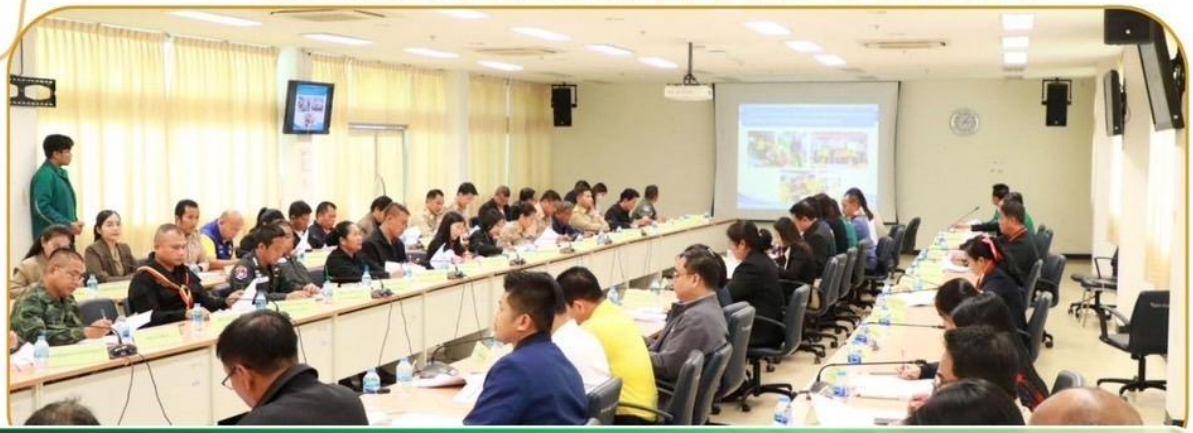
ภาพกิจกรรม 25 ธันวาคม 2567 ณ ห้องประชุมนารายณ์บรมถมสินธุ์ ชั้น 4