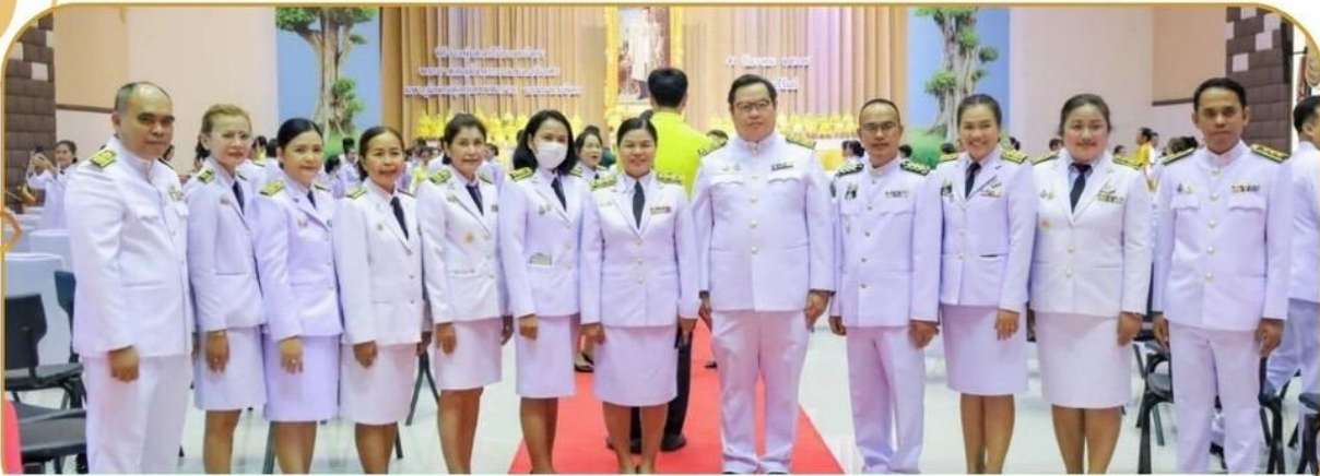
ภาพกิจกรรม 5 ธันวาคม 2567 ณ หอประชุมจังหวัดบุรีรัมย์

5 ธันวาคม วันคล้ายวันพระบรมราชสมภพ รัชกาลที่ 9 และวันพ่อแห่งชาติ ประจำปี 2567