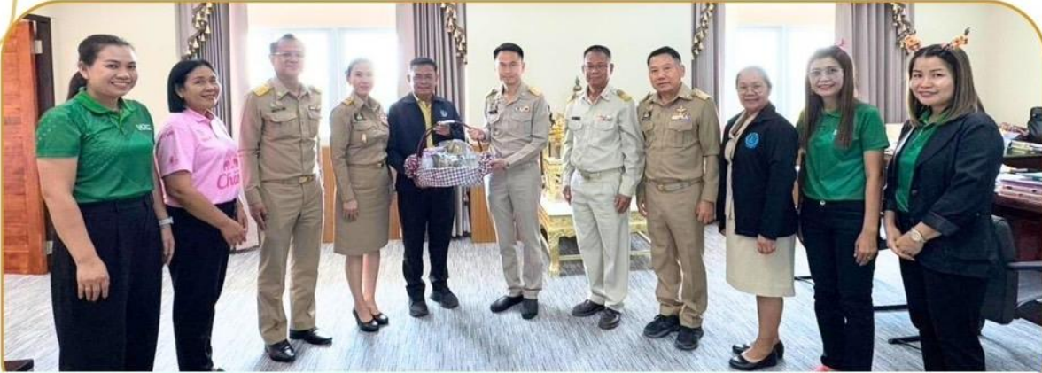
ภาพกิจกรรม 25 ธันวาคม 2567 ณ ศาลากลางจังหวัดบุรีรัมย์ ชั้น 4