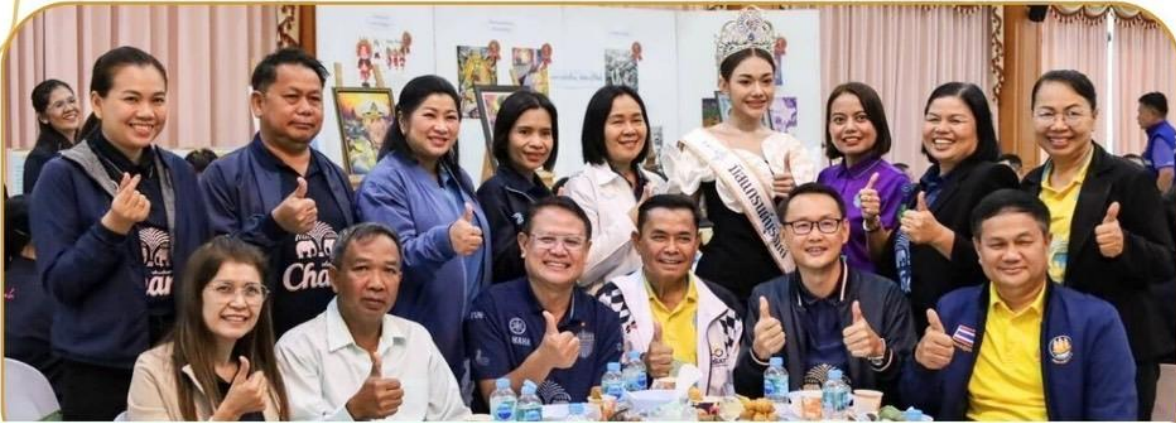
ภาพกิจกรรม 18 ธันวาคม 2567 ณ โรงเรียนบัวหลวงวิทยาคม