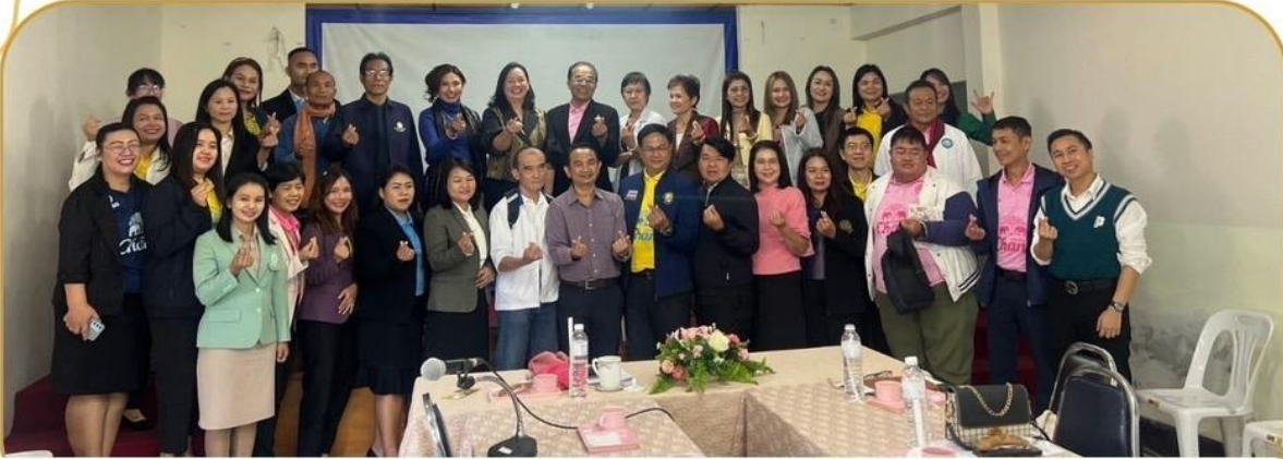
ภาพกิจกรรม 24 ธันวาคม 2567 ณ สถานีวิทยุกระจายเสียงแห่งประเทศไทยจังหวัดบุรีรัมย์