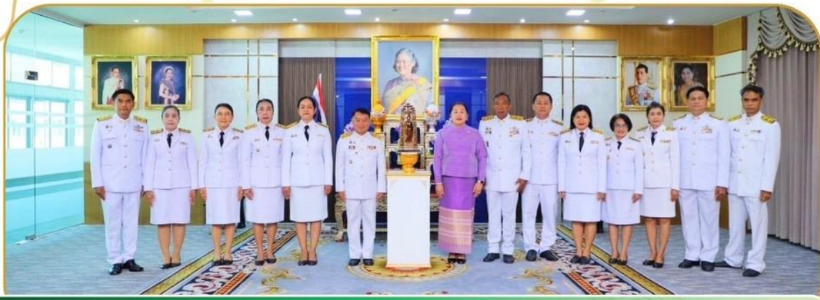
ภาพกิจกรรม 20 ธันวาคม 2567 ณ ศาลากลางจังหวัดบุรีรัมย์