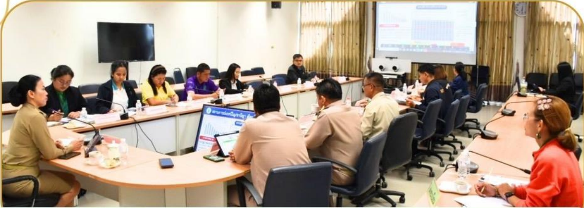
ภาพกิจกรรม 25 ธันวาคม 2567 ณ ห้องประชุมศูนย์ปฏิบัติการ ชั้น 2