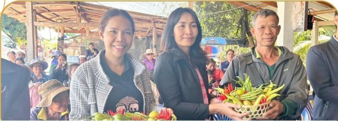
ภาพกิจกรรม 18 ธันวาคม 2567 ณ อำเภอปะคำ อำเภอบ้านกรวด อำเภอประโคนชัย