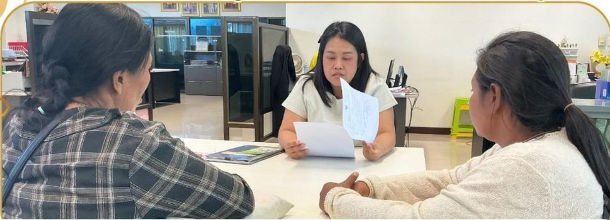
ภาพกิจกรรม 6 ธันวาคม 2567 ณ สำนักงานเกษตรและสหกรณ์จังหวัดบุรีรัมย์

เจ้าหน้าที่ฯ ชี้แจงโครงการกองทุนหมุนเวียนเพื่อการกู้ยืม แก่เกษตรกรและผู้ยากจน แก่เกษตรกรอำเภอเมืองบุรีรัมย์