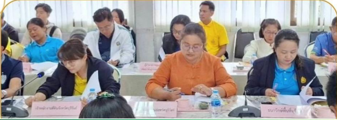
ภาพกิจกรรม 13 ธันวาคม 2567 ณ สำนักงานสหกรณ์จังหวัดบุรีรัมย์

ร่วมประชุมคณะทำงานส่งเสริมพัฒนาอาชีพและการตลาด จังหวัดบุรีรัมย์ ครั้งที่ 1