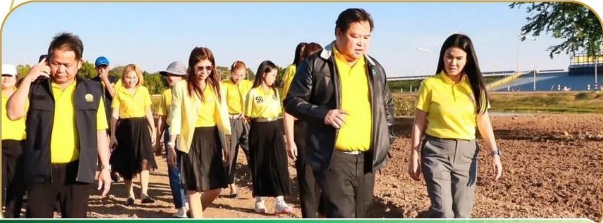
ภาพกิจกรรม 2 ธันวาคม 2567 ณ อ่างเก็บน้ำห้วยจระเข้มาก

กษ.บุรีรัมย์ และคณะ ลงพื้นที่ตรวจเยี่ยม การดำเนินการปลูกปอเทือง เพื่อเตรียมสถานที่ต้อนรับนักวิ่งบุรีรัมย์ มาราธอน ประจำปี 2568