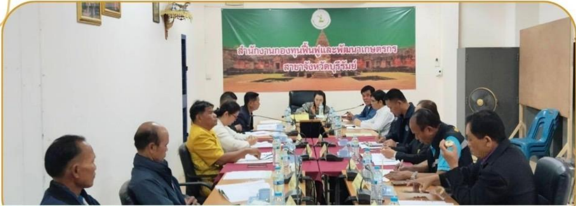
ภาพกิจกรรม 27 ธันวาคม 2567 ณ สำนักงานกองทุนฟื้นฟูและพัฒนาเกษตรกรจังหวัดบุรีรัมย์