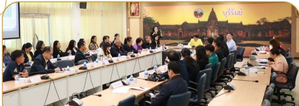
ภาพกิจกรรม 24 ธันวาคม 2567 ศาลากลางจังหวัดบุรีรัมย์