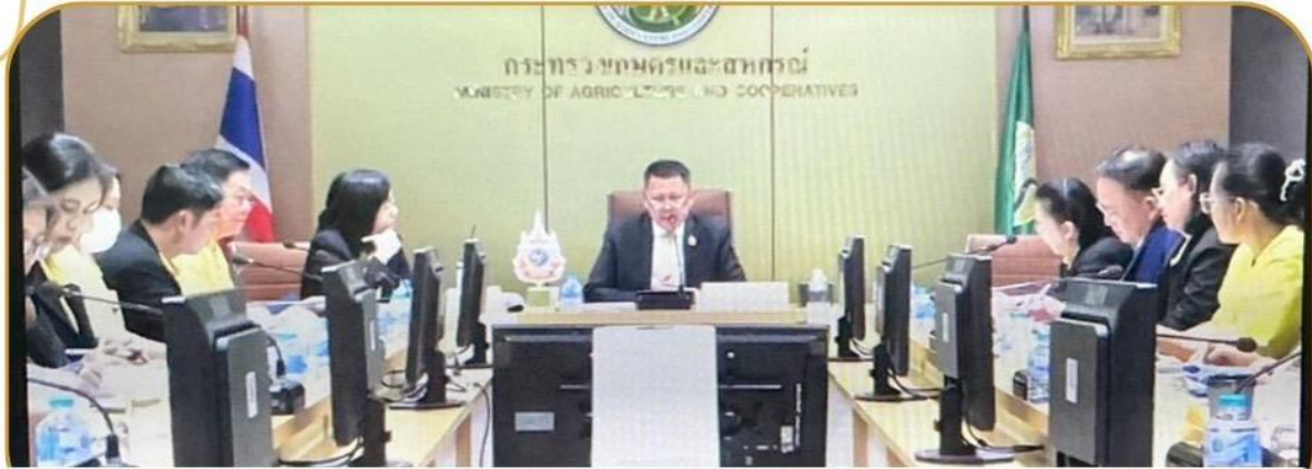
ภาพกิจกรรม 16 ธันวาคม 2567 ณ สำนักงานเกษตรและสหกรณ์จังหวัดบุรีรัมย์