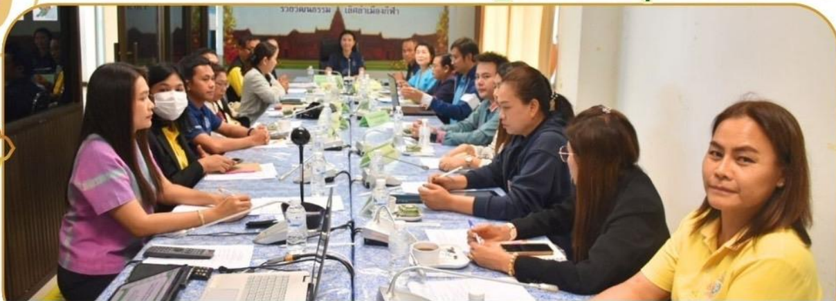
ภาพกิจกรรม 6 ธันวาคม 2567 ณ สำนักงานเกษตรและสหกรณ์จังหวัดบุรีรัมย์

"ตลาดนัดสินค้าเกษตรปลอดภัย ประชาธิปไตยร่วมใจ คนบุรีรัมย์ยิ้มได้" ครั้งที่ 1