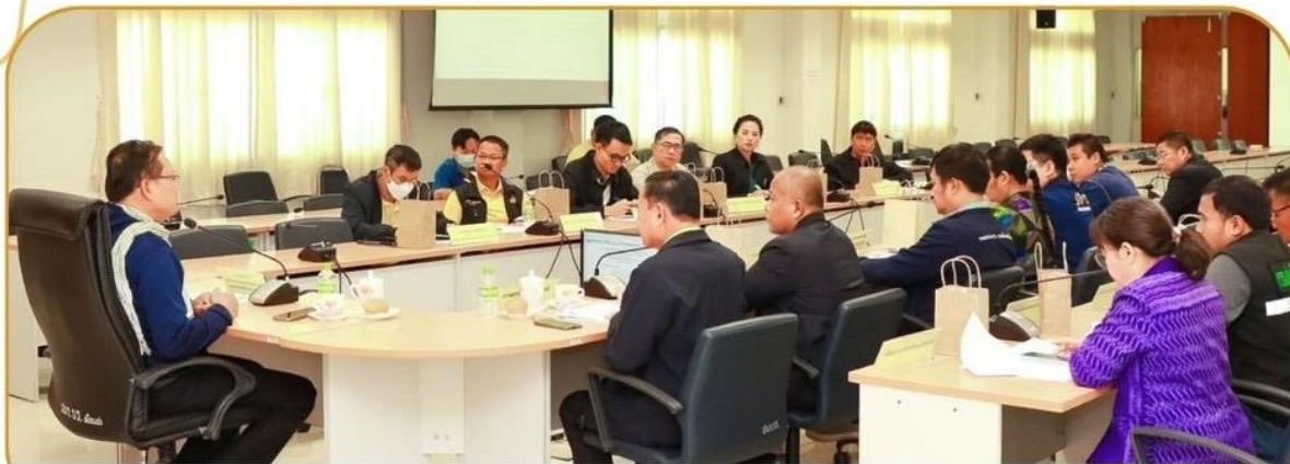
ภาพกิจกรรม 20 ธันวาคม 2567 ณ ห้องประชุมพนมรุ้ง ชั้น 4 ศาลากลางจังหวัดบุรีรัมย์

ประชุมเตรียมการติดตามผล การดำเนินโครงการปรับปรุงซ่อมแซม เสริมศักยภาพแหล่งน้ำขนาดเล็ก ปี พ.ศ.2567-2568 ๔