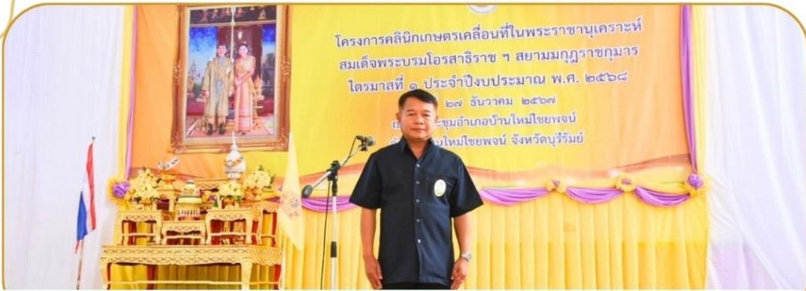
ภาพกิจกรรม 27 ธันวาคม 2567 ณ อำเภอบ้านใหม่ไชยพจน์