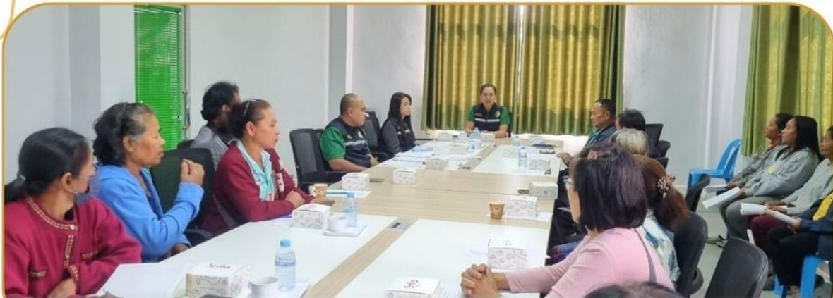
ภาพกิจกรรม 20 ธันวาคม 2567 ณ สหกรณ์การเกษตรอำเภอหนองหงส์