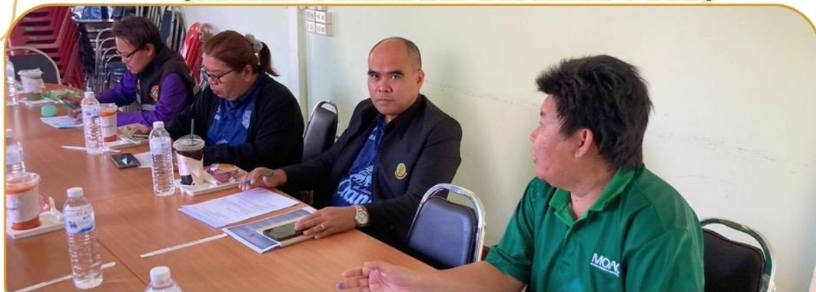
ภาพกิจกรรม 18 ธันวาคม 2567 ณ สำนักงานเกษตรอำเภอสตึก