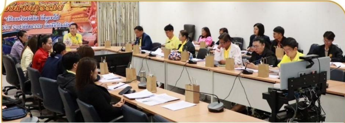
ภาพกิจกรรม 24 ธันวาคม 2567 ศาลากลางจังหวัดบุรีรัมย์