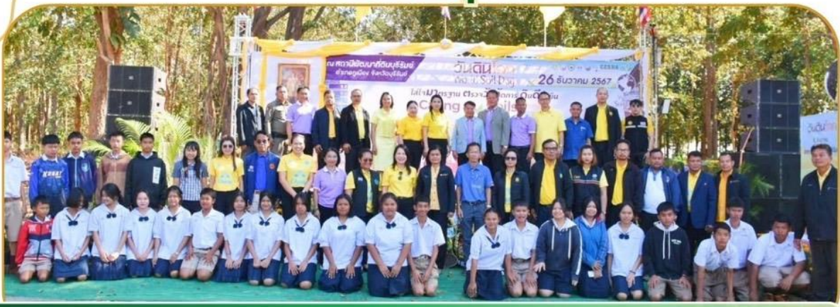
ภาพกิจกรรม 26 ธันวาคม 2567 ณ สถานีพัฒนาที่ดินบุรีรัมย์