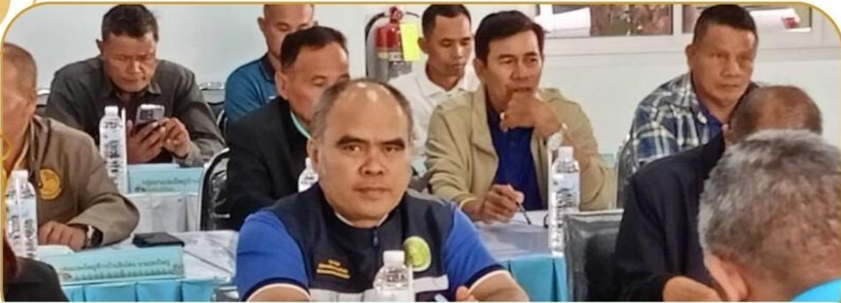
ภาพกิจกรรม 13 ธันวาคม 2567 ณ ศูนย์เมล็ดพันธุ์ข้าวบุรีรัมย์

หน่วยงานภาคีร่วมกับผู้นำกลุ่มนาแปลงใหญ่ระดับจังหวัด ภายใต้โครงการระบบส่งเสริมเกษตรแบบแปลงใหญ่ ปี 2568