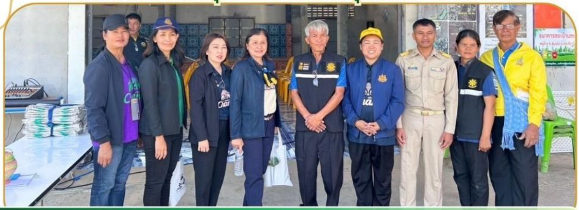
ภาพกิจกรรม 25 ธันวาคม 2567 ณ อำเภอกระสัง และอำเภอเมืองบุรีรัมย์

ร่วมตรวจติดตามโครงการตามแผนปฏิบัติการ ประจำปีของคช.จังหวัดและกลุ่มจังหวัดภาคอีสานฯ