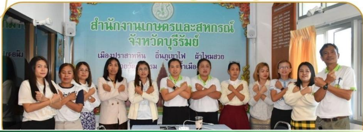
ภาพกิจกรรม 19 ธันวาคม 2567 ณ สำนักงานเกษตรและสหกรณ์จังหวัดบุรีรัมย์