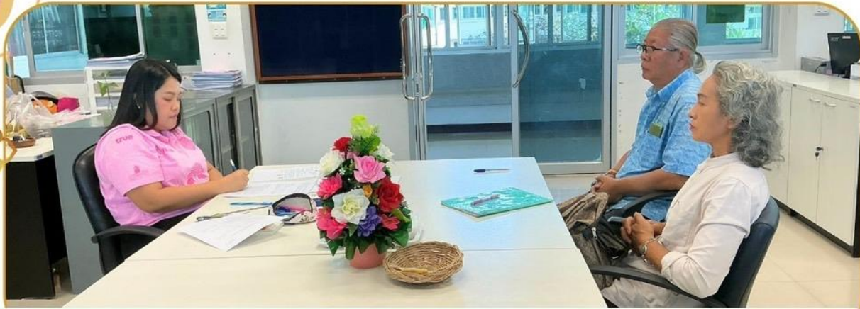
ภาพกิจกรรม 11 ธันวาคม 2567 ณ สำนักงานเกษตรและสหกรณ์จังหวัดบุรีรัมย์

เจ้าหน้าที่ฯ ชี้แจงโครงการกองทุนหมุนเวียนเพื่อการกู้ยืม แก่เกษตรกรและผู้ยากจน แก่เกษตรกรอำเภอนางรอง