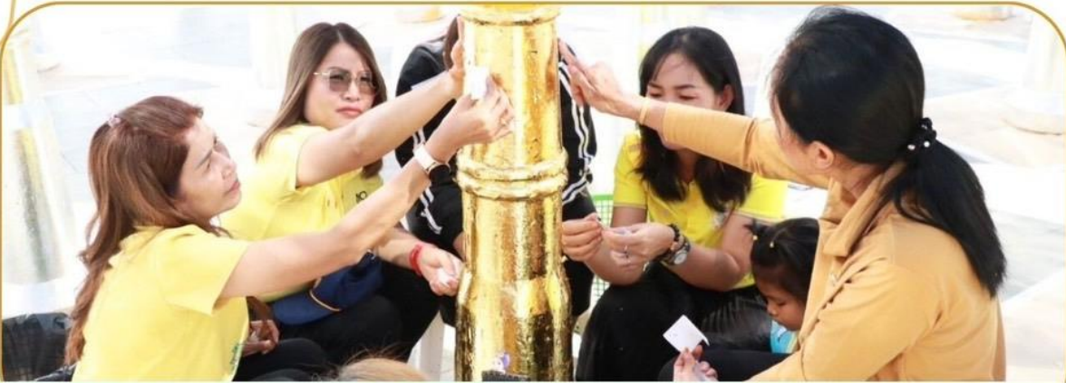
ภาพกิจกรรม 27 ธันวาคม 2567 ณ บริเวณพระบรมราชานุสาวรีย์ฯ (รัชกาลที่ 1)