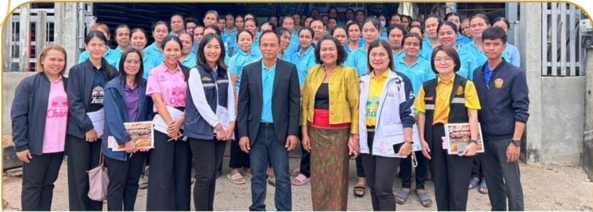
ภาพกิจกรรม 13 ธันวาคม 2567 ณ จังหวัดบุรีรัมย์

ตรวจติดตามโครงการตามแผนปฏิบัติการราชการประจำปี อำเภอนางรอง อำเภอเฉลิมพระเกียรติ อำเภอพุทไธสง อำเภอกุเมือง