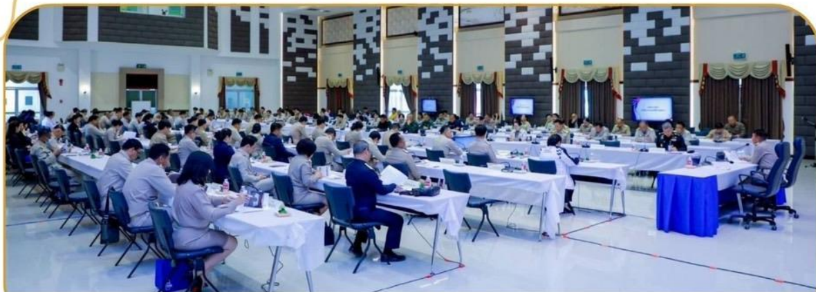
ภาพกิจกรรม 25 ธันวาคม 2567 ณ หอประชุมจังหวัดบุรีรัมย์