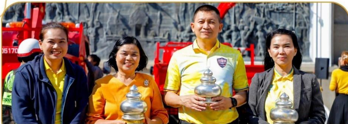
ภาพกิจกรรม 24 ธันวาคม 2567 ณ บริเวณพระบรมราชานุสาวรีย์ฯ (รัชกาลที่ 1)

โครงการปิดทองเม็กฟ้า สักการบูชา มหาราชกาลที่ 1 (นำยอดฉัตร 364 ต้น ลงจากยอดฉัตร)