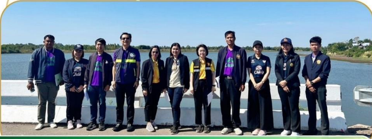
ภาพกิจกรรม 4 ธันวาคม 2567 ณ อำเภอคูเมือง อำเภอพุทไธสง อำเภอสตึก

ร่วมตรวจติดตามโครงการตามแผนปฏิบัติการราชการประจำปี ของจังหวัดและกลุ่มจังหวัดภาคตะวันออกเฉียงเหนือตอนล่าง 1