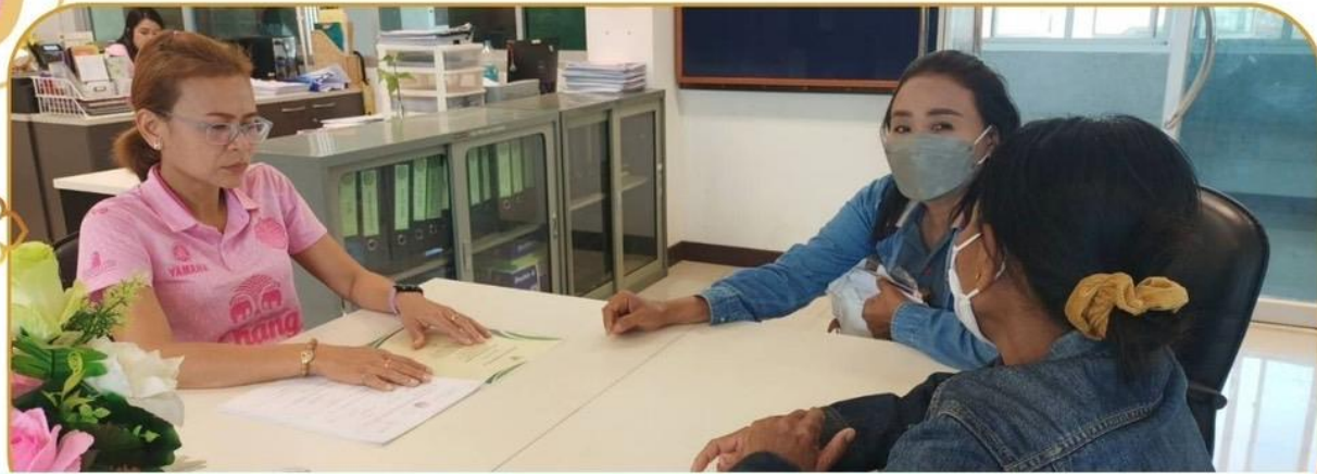
ภาพกิจกรรม 11 ธันวาคม 2567 ณ สำนักงานเกษตรและสหกรณ์จังหวัดบุรีรัมย์

เจ้าหน้าที่ฯ ชี้แจงโครงการกองทุนสงเคราะห์เกษตรกร แก่เกษตรกรอำเภอนางรอง