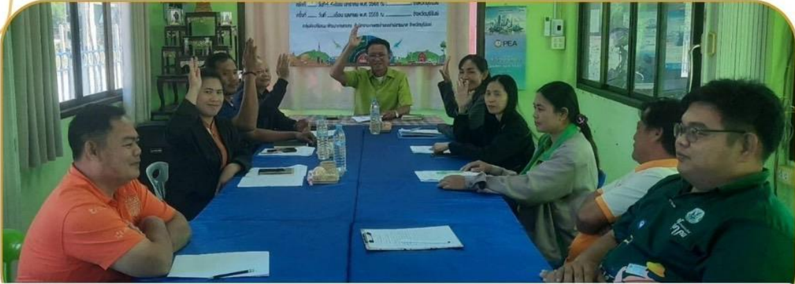
ภาพกิจกรรม 30 มกราคม 2568 ณ สำนักงานเกษตรอำเภอลำปลายมาศ