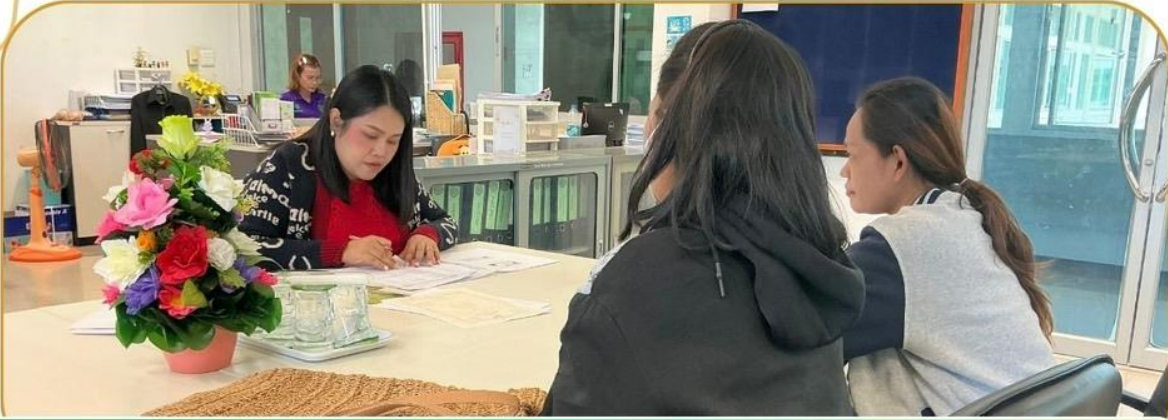
ภาพกิจกรรม 3 มกราคม 2568 ณ สำนักงานเกษตรและสหกรณ์จังหวัดบุรีรัมย์

เจ้าหน้าที่ฯ ชี้แจงโครงการกองทุนหมุนเวียนเพื่อการกู้ยืม แก่เกษตรกรและผู้ยากจน แก่เกษตรกรอำเภอกระสัง