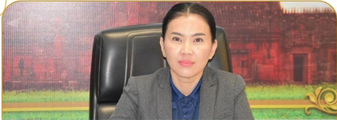
ภาพกิจกรรม 8 มกราคม 2568 ณ สำนักงานเกษตรและสหกรณ์จังหวัดบุรีรัมย์