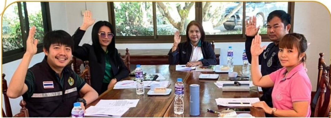
ภาพกิจกรรม 30 มกราคม 2568 ณ สำนักงานเกษตรอำเภอละหารทราย