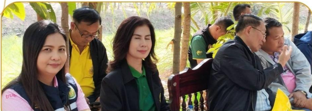
ภาพกิจกรรม 22 มกราคม 2568 ณ อำเภอประโคนชัย