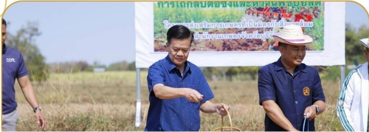
ภาพกิจกรรม 27 มกราคม 2568 ณ อำเภอคูเมือง