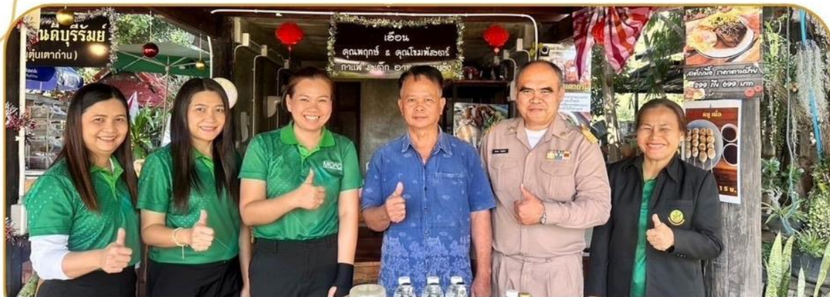
ภาพกิจกรรม 13 มกราคม 2568 ณ อำเภอเมืองบุรีรัมย์