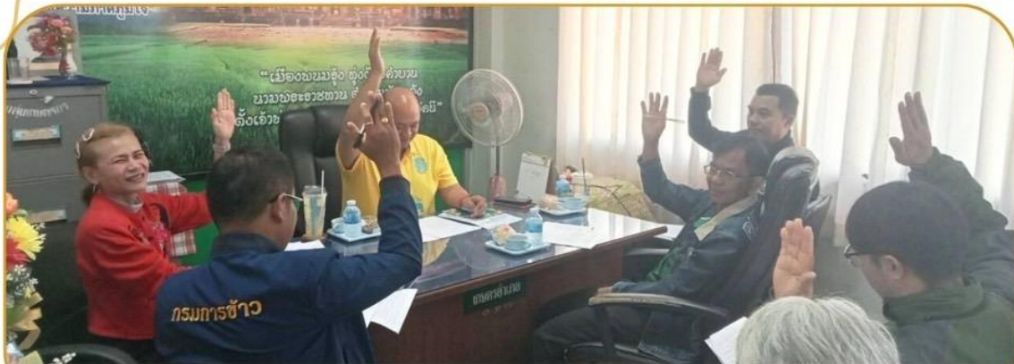
ภาพกิจกรรม 29 มกราคม 2568 ณ สำนักงานเกษตรอำเภอพลับพลาชัย