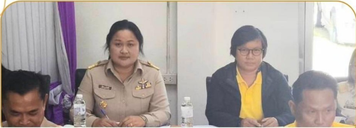
ภาพกิจกรรม 6 มกราคม 2568 ณ องค์การบริหารส่วนตำบลปะเคียบ