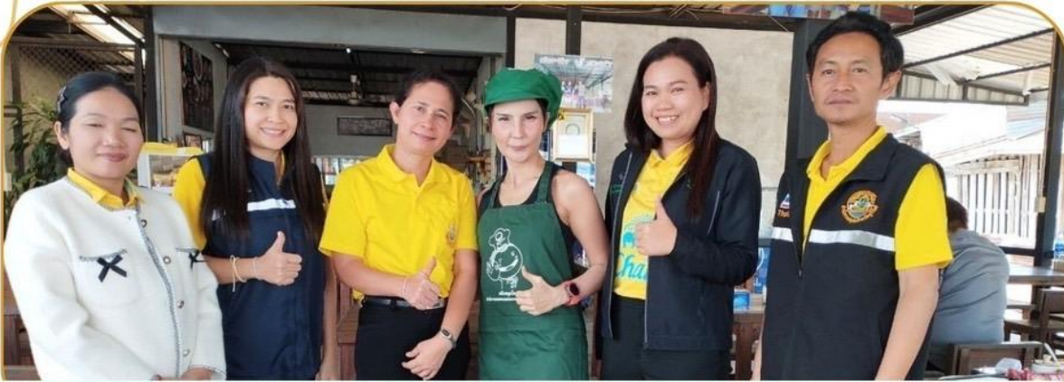
ภาพกิจกรรม 20-21 มกราคม 2568 ณ จังหวัดบุรีรัมย์