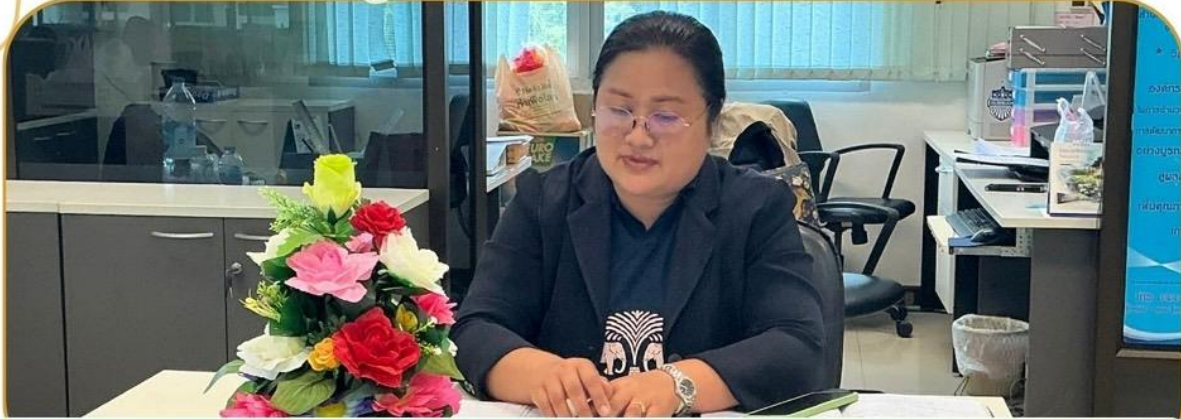
ภาพกิจกรรม 15 มกราคม 2568 ณ สำนักงานเกษตรและสหกรณ์จังหวัดบุรีรัมย์