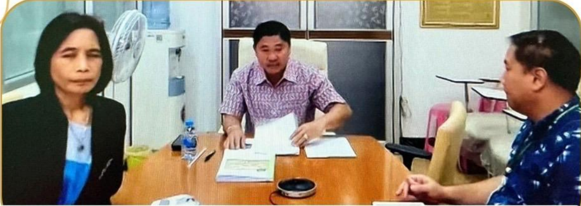
ภาพกิจกรรม 14 มกราคม 2568 ณ สำนักงานเกษตรและสหกรณ์จังหวัดบุรีรัมย์