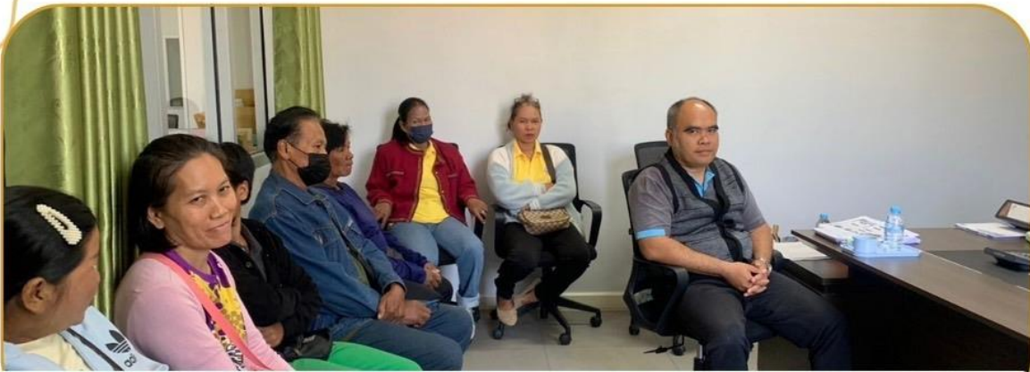
ภาพกิจกรรม 9 มกราคม 2568 ณ อำเภอหนองหงส์

ลงพื้นที่สำรวจข้อมูลเพิ่มเติมเกษตรกรผู้เข้าร่วม โครงการส่งเสริมและพัฒนาสินค้าเกษตรชีวภาพฯ อ.หนองหงส์