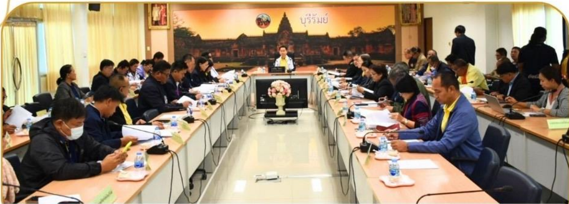
ภาพกิจกรรม 8 มกราคม 2568 ณ ศาลากลางจังหวัดบุรีรัมย์