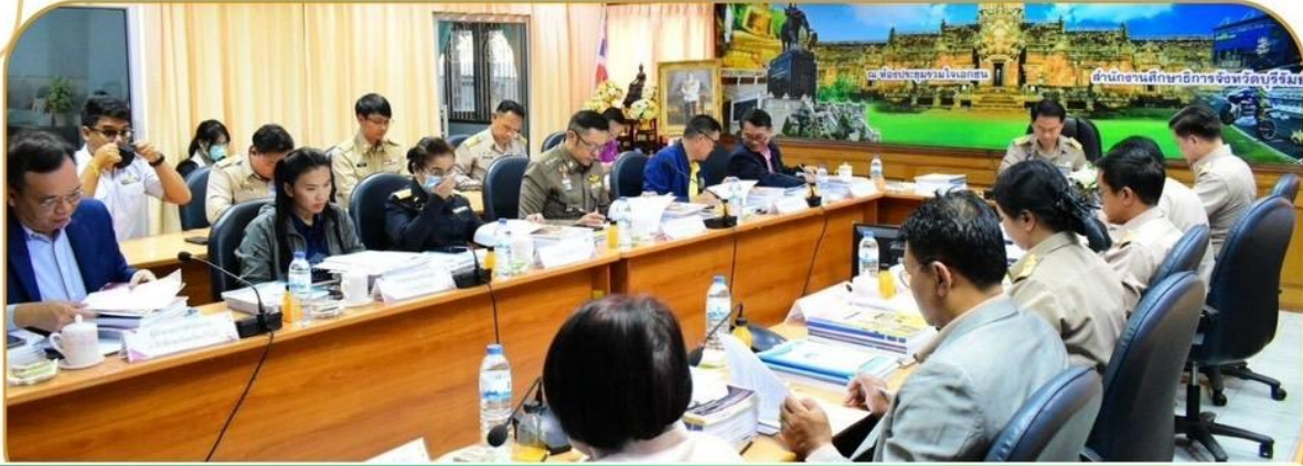
ภาพกิจกรรม 31 มกราคม 2568 ณ สำนักงานศึกษาธิการจังหวัดบุรีรัมย์