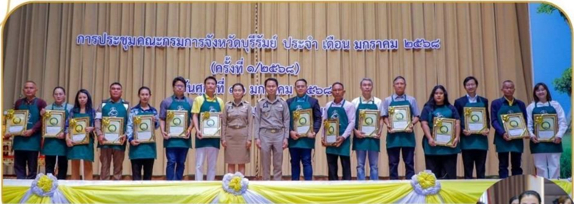
ภาพกิจกรรม 31 มกราคม 2568 ณ หอประชุมจังหวัดบุรีรัมย์