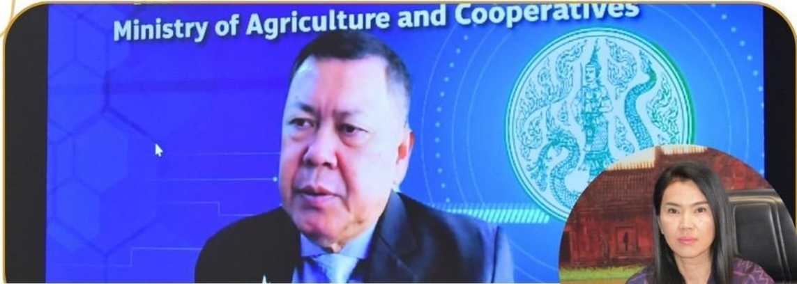
ภาพกิจกรรม 9 มกราคม 2568 ณ สำนักงานเกษตรและสหกรณ์จังหวัดบุรีรัมย์

Ministry of Agriculture and Cooperatives