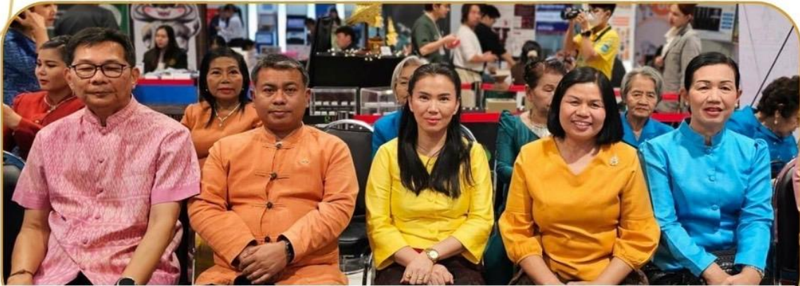
ภาพกิจกรรม 31 มกราคม 2568 ณ ศูนย์การค้าโรบินสัน ไลฟ์สไตล์ บุรีรัมย์