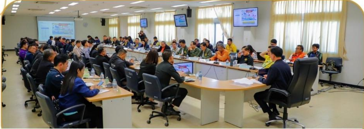
ภาพกิจกรรม 16 มกราคม 2568 ณ ห้องประชุมนารายณ์บรมถนสินธุ์ ชั้น 4