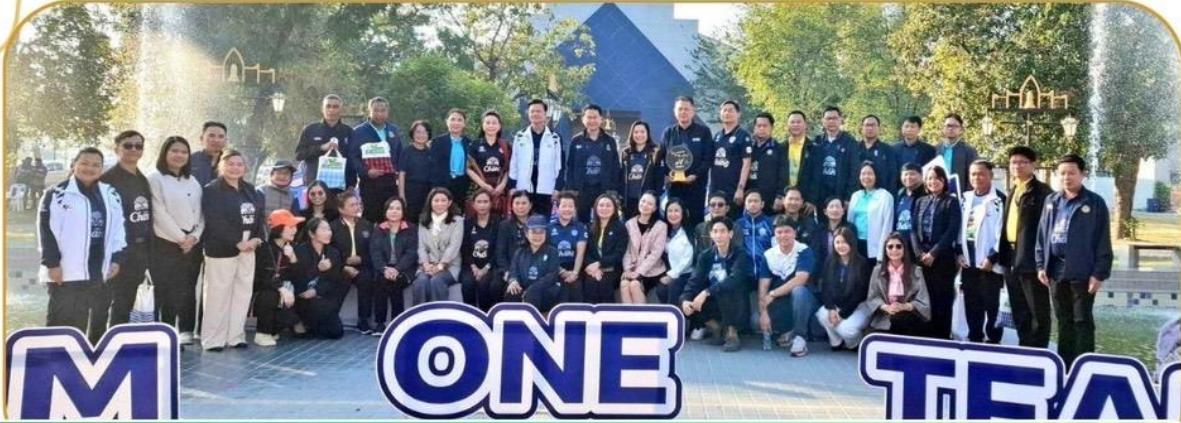
ภาพกิจกรรม 22 มกราคม 2568 ณ สวนสาธารณะข้างโดมสวนรมย์บุรี 200 ปี