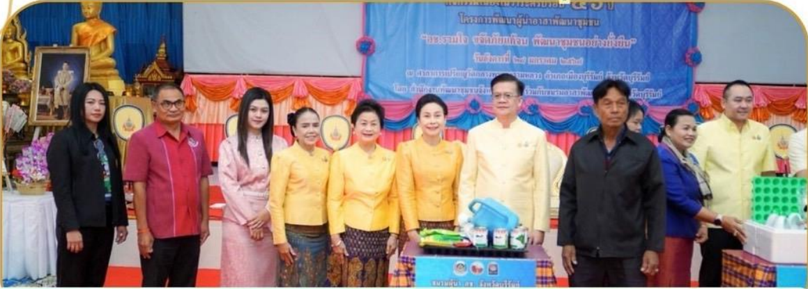
ภาพกิจกรรม 28 มกราคม 2568 ณ วัดกลางพระอารามหลวง

ร่วมกิจกรรม ครบรอบ 56 ปี "อช.รวมใจ งดัดภัยแก่งจน พัฒนาชุมชนอย่างยั่งยืน"