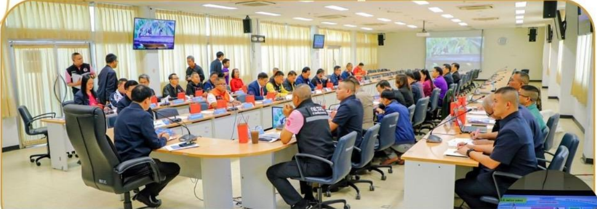
ภาพกิจกรรม 29 มกราคม 2568 ณ ห้องประชุมนารายณ์บรมกมสินธุ์ ชั้น 4