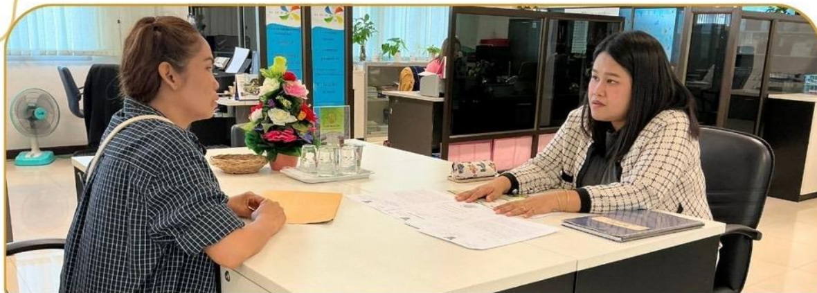
ภาพกิจกรรม 23 มกราคม 2568 ณ สำนักงานเกษตรและสหกรณ์จังหวัดบุรีรัมย์

ชี้แจงโครงการกองทุนหมุนเวียนเพื่อการกู้ยืม แก่เกษตรกรและผู้ยากจน แก่เกษตรกรอำเภอเมืองบุรีรัมย์