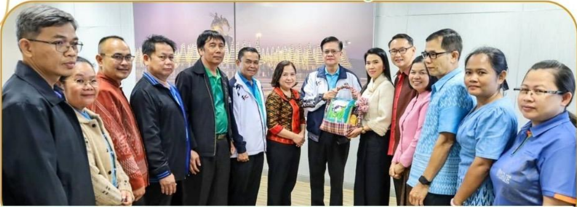
ภาพกิจกรรม 10 มกราคม 2568 ณ ศาลากลางจังหวัดบุรีรัมย์ ชั้น 4