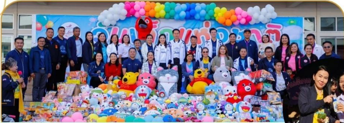
ภาพกิจกรรม 11 มกราคม 2568 ณ ศูนย์ราชการจังหวัดบุรีรัมย์