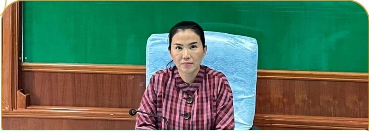
ภาพกิจกรรม 21 มกราคม 2568 ณ สำนักงานเกษตรจังหวัดบุรีรัมย์