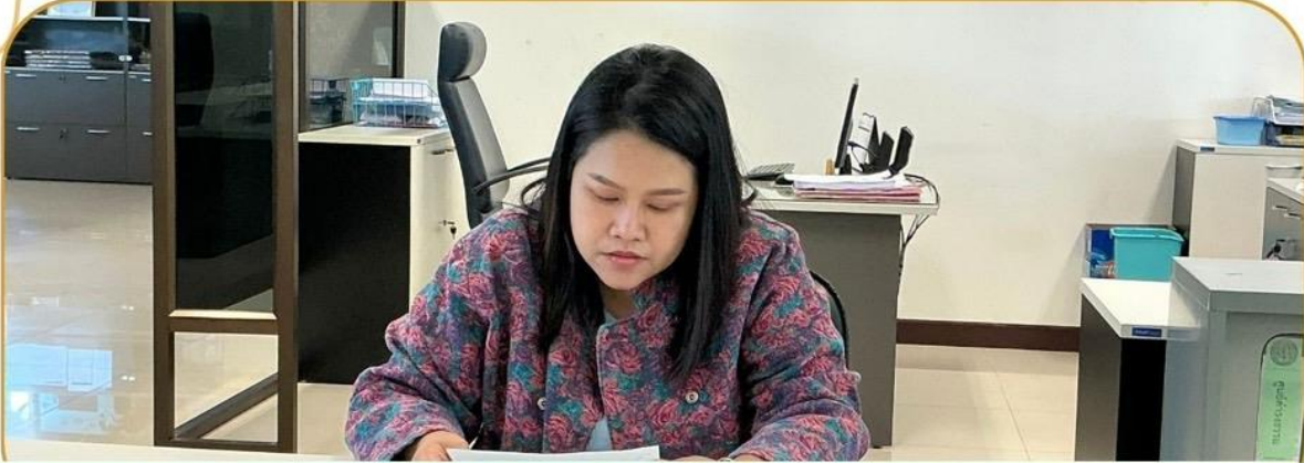
ภาพกิจกรรม 14 มกราคม 2568 ณ สำนักงานเกษตรและสหกรณ์จังหวัดบุรีรัมย์

เจ้าหน้าที่ฯ ชี้แจงโครงการกองทุนหมุนเวียนเพื่อการกู้ยืม แก่เกษตรกรและผู้ยากจน แก่เกษตรกรอำเภอเมืองบุรีรัมย์ อำเภอลำปลายมาศ