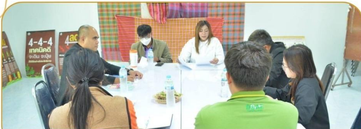
ภาพกิจกรรม 30 มกราคม 2568 ณ สำนักงานเกษตรอำเภอห้วยราช