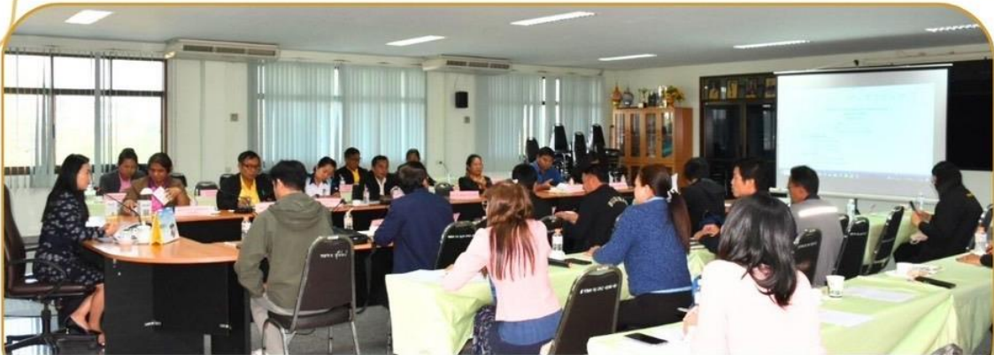
ภาพกิจกรรม 7 มกราคม 2568 ณ การยางแห่งประเทศไทยจังหวัดบุรีรัมย์