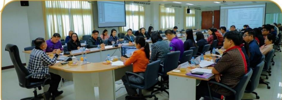
ภาพกิจกรรม 21 มกราคม 2568 ณ ศาลากลางจังหวัดบุรีรัมย์