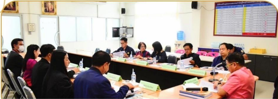
ภาพกิจกรรม 29 มกราคม 2568 ณ ศาลากลางจังหวัดบุรีรัมย์ ชั้น 3