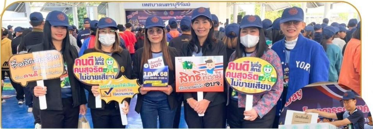
ภาพกิจกรรม 28 มกราคม 2568 ณ โดมสวนรมย์บุรี 200 ปี