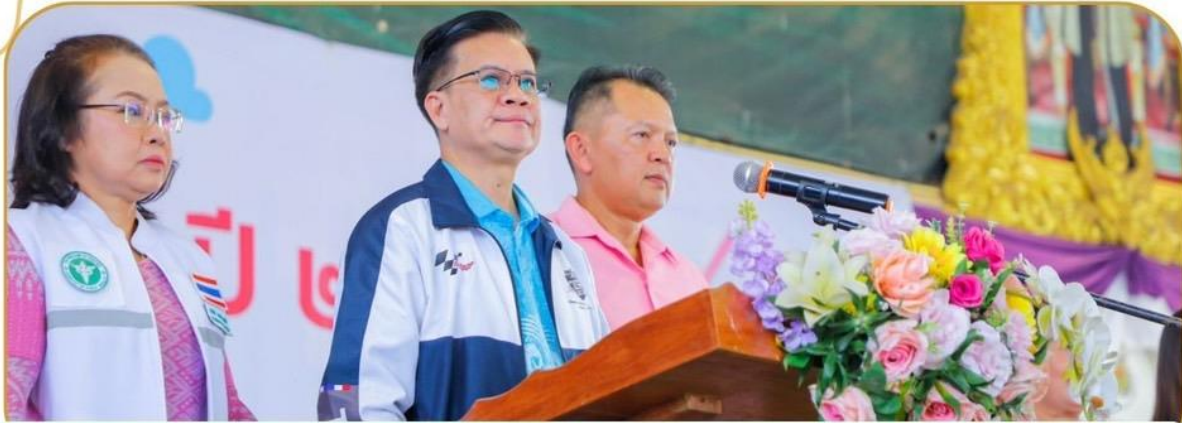
ภาพกิจกรรม 24 มกราคม 2568 ณ หอประชุมวิทยาลัยเกษตรและเทคโนโลยีบุรีรัมย์