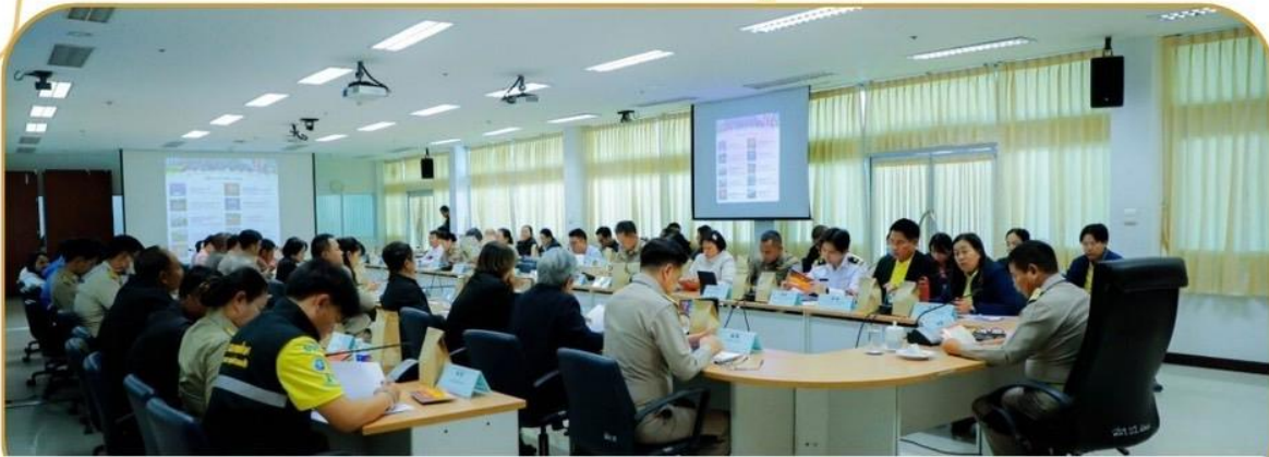
ภาพกิจกรรม 6 มกราคม 2568 ณ ศาลากลางจังหวัดบุรีรัมย์