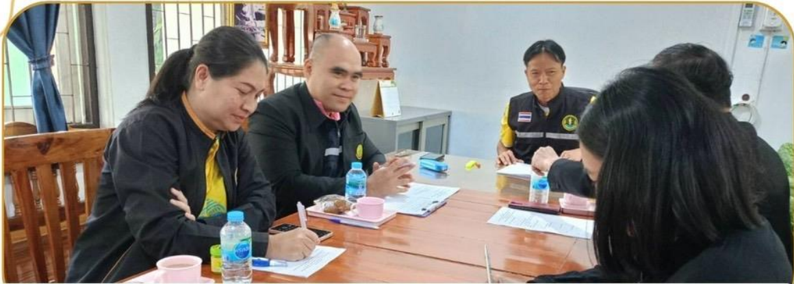
ภาพกิจกรรม 29 มกราคม 2568 ณ สำนักงานเกษตรอำเภอพลับพลายชัย