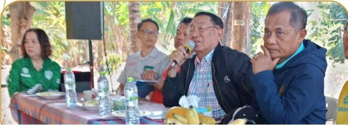
ภาพกิจกรรม 23 มกราคม 2568 ณ อำเภอโนนสุวรรณ