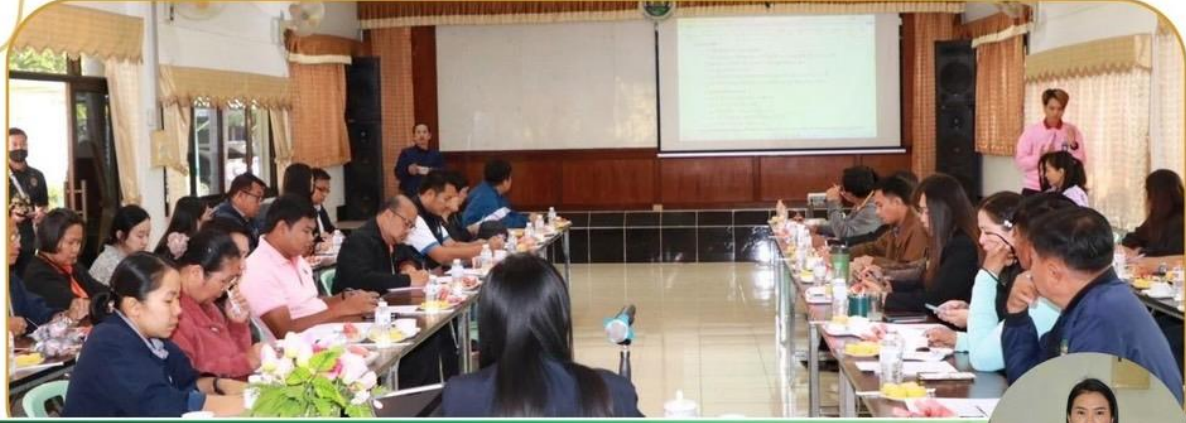
ภาพกิจกรรม 16 มกราคม 2568 ณ ศูนย์วิจัยและพัฒนาการเกษตรบุรีรัมย์