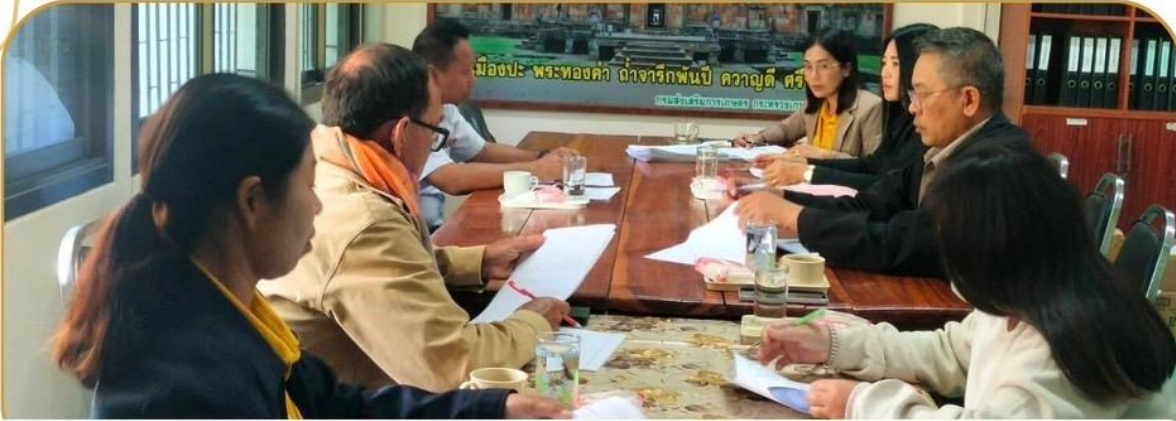
ภาพกิจกรรม 27 มกราคม 2568 ณ อำเภอปะคำ อำเภอบ้านกรวด