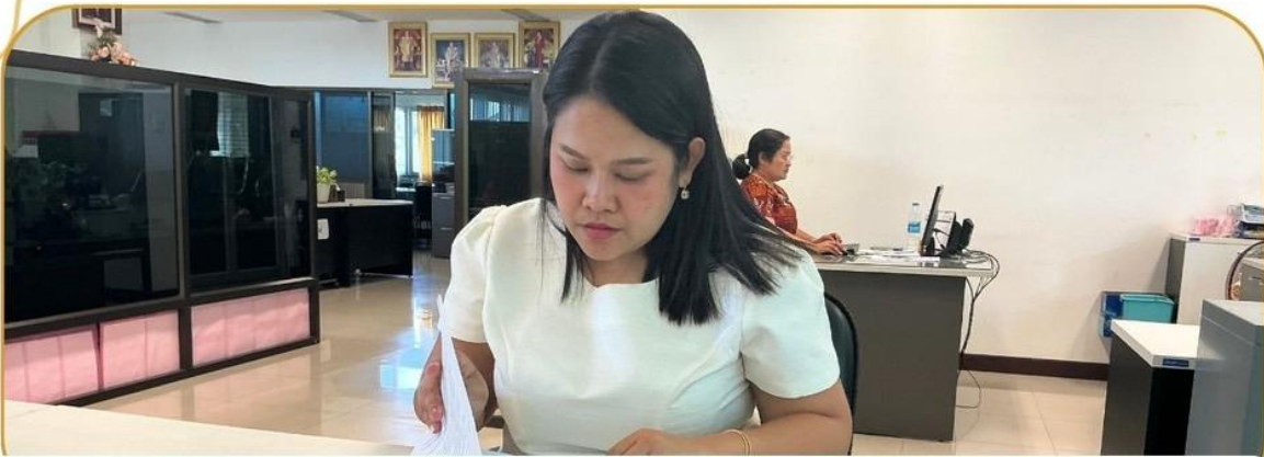
ภาพกิจกรรม 9 มกราคม 2568 ณ สำนักงานเกษตรและสหกรณ์จังหวัดบุรีรัมย์

เจ้าหน้าที่ฯ ชี้แจงโครงการกองทุนหมุนเวียนเพื่อการกู้ยืม แก่เกษตรกรและผู้ยากจน แก่เกษตรกรอำเภอประโคนชัย อำเภอบ้านกรวด