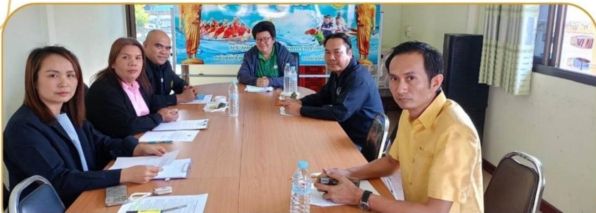
ภาพกิจกรรม 21 มกราคม 2568 ณ สำนักงานเกษตรอำเภอสตึก