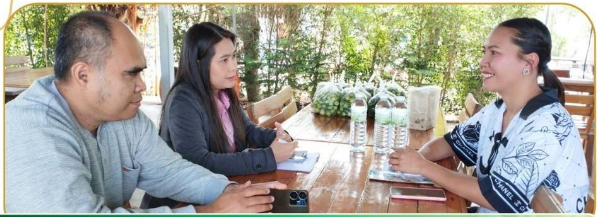
ภาพกิจกรรม 15 มกราคม 2568 ณ อำเภอเมืองบุรีรัมย์