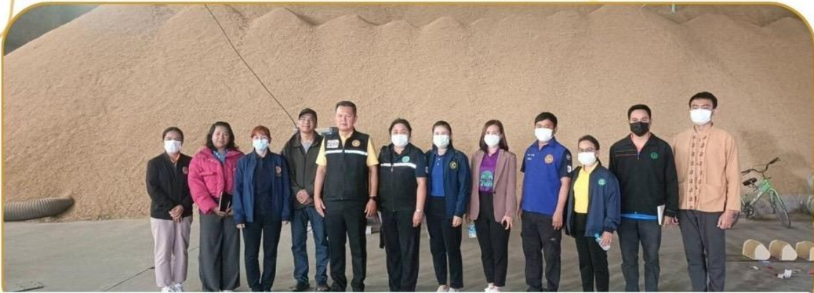
ภาพกิจกรรม 7 มกราคม 2568 ณ จังหวัดบุรีรัมย์

ร่วมตรวจสต็อกข้าว ผู้เข้าร่วมโครงการชดเชยดอกเบี้ยฯ ปีการผลิต 2567/68 จังหวัดบุรีรัมย์