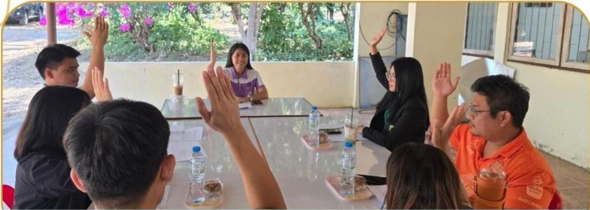
ภาพกิจกรรม 30 มกราคม 2568 ณ สำนักงานเกษตรอำเภอโนนดินแดง