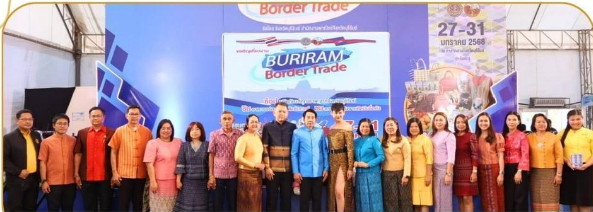
ภาพกิจกรรม 27 มกราคม 2568 ณ ศาลากลางจังหวัดบุรีรัมย์ (หลังเก่า)

กษ.บุรีรัมย์ ร่วมพิธีเปิดงานแสดง และจำหน่ายสินค้าและการเจรจาธุรกิจ (BURIRAM BORDER TRADE)