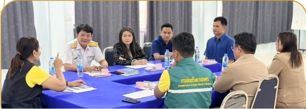
ภาพกิจกรรม 27 มกราคม 2568 ณ สำนักงานเกษตรอำเภอเมืองบุรีรัมย์

ร่วมประชุมการขับเคลื่อนงานด้านการเกษตรฯ (SINGLE COMMAND DISTRICT) อำเภอเมืองบุรีรัมย์