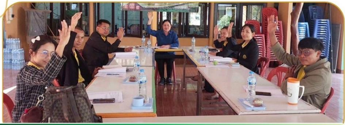
ภาพกิจกรรม 27 มกราคม 2568 ณ สำนักงานเกษตรอำเภอชำนิ