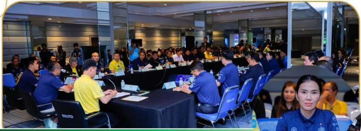
ภาพกิจกรรม 8 มกราคม 2568 ณ สยามช้างอารีนา