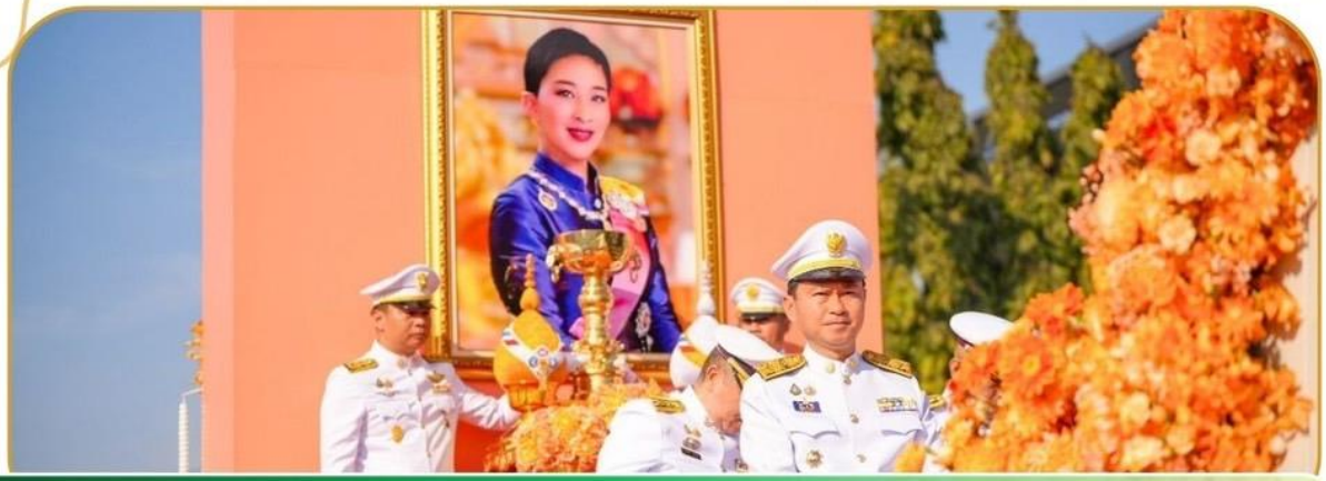
ภาพกิจกรรม 24 มกราคม 2568 ณ พระบรมราชานุสาวรีย์พระบาทสมเด็จพระพุทธยอดฟ้าจุฬาโลกมหาราช (รัชกาลที่ 1)