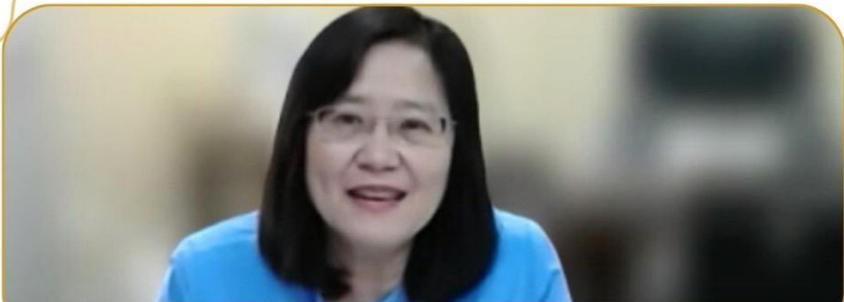
ภาพกิจกรรม 24 มกราคม 2568 ณ สำนักงานเกษตรและสหกรณ์จังหวัดบุรีรัมย์