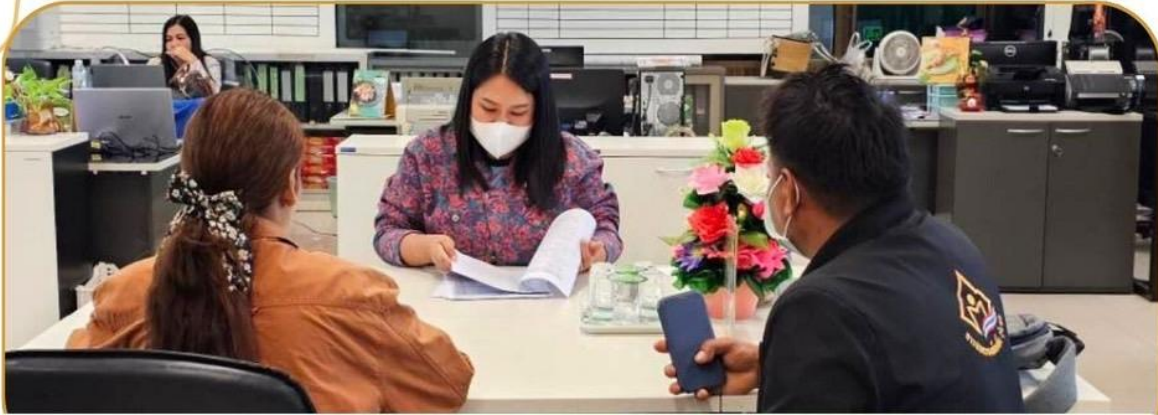
ภาพกิจกรรม 28 มกราคม 2568 ณ สำนักงานเกษตรและสหกรณ์จังหวัดบุรีรัมย์