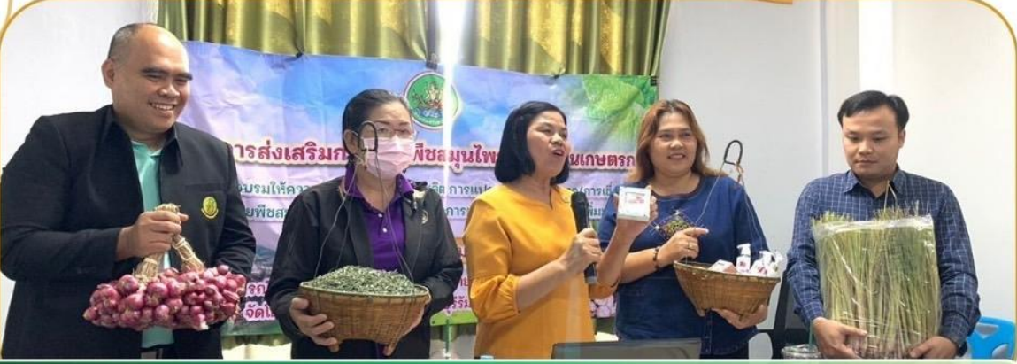
ภาพกิจกรรม 31 มกราคม 2568 ณ สหกรณ์การเกษตรหนองหงส์ จำกัด