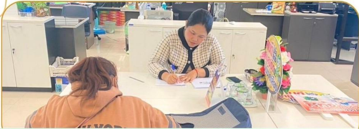
ภาพกิจกรรม 30 มกราคม 2568 ณ สำนักงานเกษตรและสหกรณ์จังหวัดบุรีรัมย์