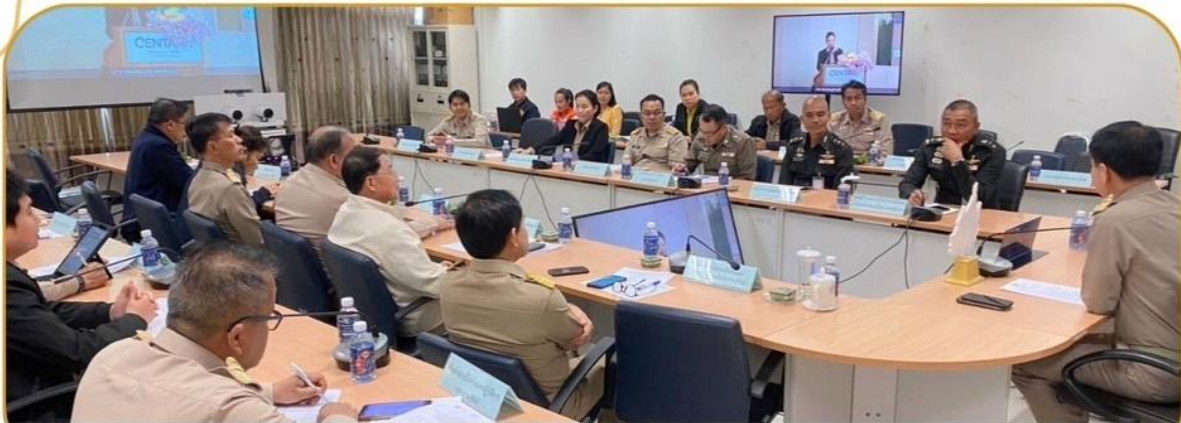
ภาพกิจกรรม 27 มกราคม 2568 ณ ห้องประชุมศูนย์ปฏิบัติการ