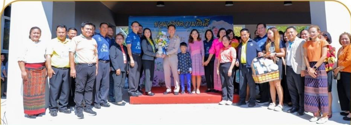
ภาพกิจกรรม 2 มกราคม 2568 ณ จวนผู้ว่าราชการจังหวัดบุรีรัมย์