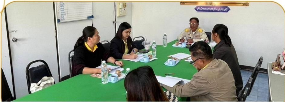
ภาพกิจกรรม 27 มกราคม 2568 ณ สำนักงานเกษตรอำเภอกระสัง

ร่วมประชุมการขับเคลื่อนงานด้านการเกษตรฯ SINGLE COMMAND DISTRICT อำเภอกระสัง