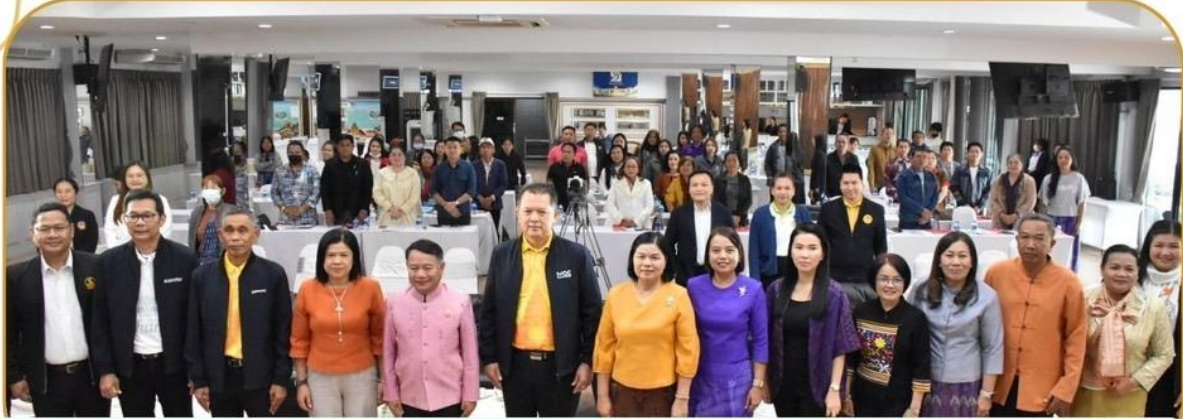
ภาพกิจกรรม 16 มกราคม 2568 ณ โรงแรมบุรีเทิล