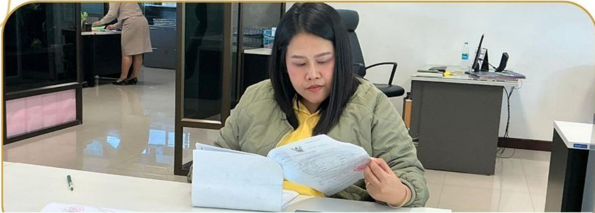
ภาพกิจกรรม 20 มกราคม 2568 ณ สำนักงานเกษตรและสหกรณ์จังหวัดบุรีรัมย์