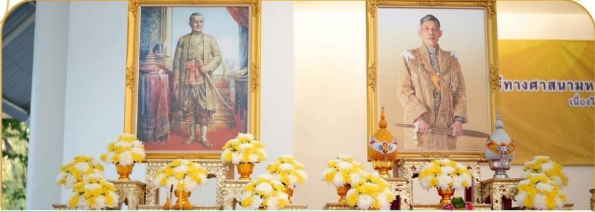
ภาพกิจกรรม 14 มกราคม 2568 ณ โดมสวนรมย์บุรี 200 ปี