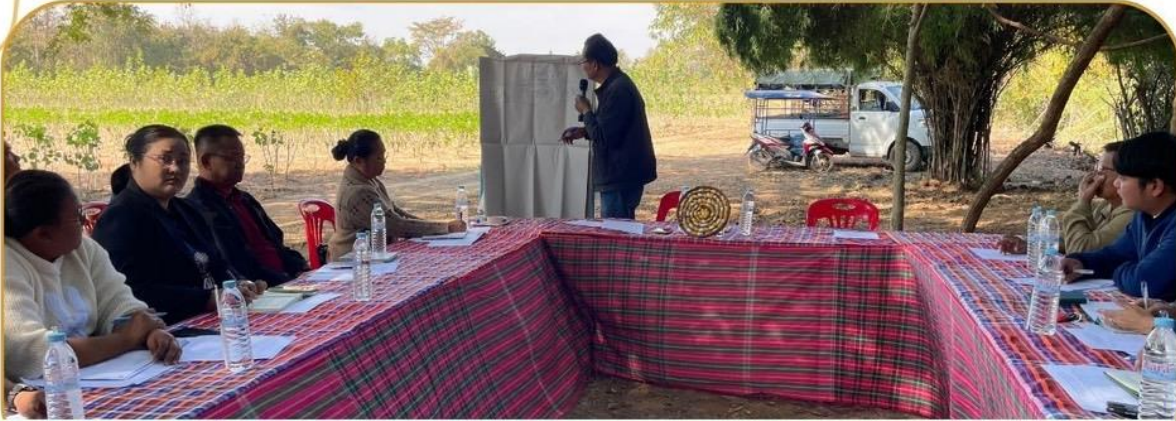
ภาพกิจกรรม 13-14 มกราคม 2568 ณ อำเภอแคนดง และอำเภอนองหงส์