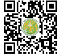
ด้านปศุสัตว์

เสนอที่ประชุมเพื่อโปรดพิจารณาให้ความเห็นชอบข้อมูลปฏิทินผลผลิตสินค้าเกษตรรายเดือนระดับจังหวัด ปี ๒๕๖๗ ของจังหวัดฉะเชิงเทรา และใช้ประโยชน์ต่อไป