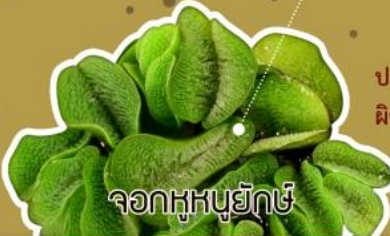
จอกหูหนูยักษ์

ใบเป็นแผ่นมันวาวกลม คล้ายหูหนู ขนบนใบ เป็นเส้นตรง