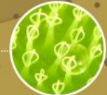
ภาพแสดงลักษณะขนบนใบ

ปลายใบยกตัวขึ้นและแยกออกจากกัน ผิวใบด้านบนปกคลุมด้วยขนยาว ที่ปลายลักษณะคล้ายซี่กรง