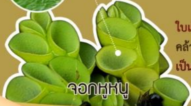
จอกหูหนู

ใบเป็นแผ่นมันวาวกลม คล้ายหูหนู ขนบนใบ เป็นเส้นตรง