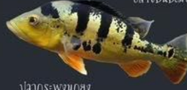
ปลากรงพวงขง