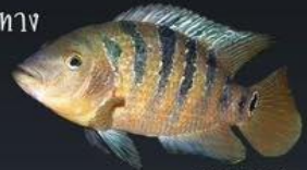
ปลาหมอมาฮัน