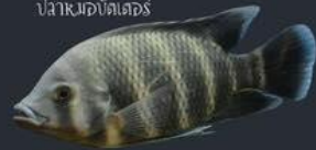
ปลากรงปลาคาง

การเพิ่มปริมาณของสัตว์ต่างถิ่นมากเกินไป เช่น ปลากรงปลาคาง ปลากรงปลาคาง รอยเชอ์ สัตว์น้ำต่างถิ่นเหล่านี้จะไปแย่งแย่งถิ่นที่อยู่อาศัย แหล่งอาหาร และแหล่งวางไข่ของสัตว์น้ำพื้นเมือง ทำให้สัตว์น้ำบางชนิดที่อ่อนไหวลดจำนวนลง และอาจสูญพันธุ์ไปจากแหล่งน้ำได้