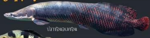
ปลาช่อนอเมริกา

ทำให้สมดุลนิเวศแหล่งน้ำเปลี่ยนแปลง เนื่องจากสัตว์น้ำต่างถิ่นบางชนิดกินพืช สัตว์น้ำต่างถิ่นบางชนิดเป็นพื้ล่า กินสัตว์น้ำพื้นเมืองเป็นอาหาร หากสัตว์น้ำต่างถิ่นเพิ่มปริมาณมากๆ จะทำให้จำนวนชนิดสัตว์น้ำใน แหล่งน้ำลดลง เกิดผลเสียต่อองค์ประกอบชนิดสัตว์น้ำและพื้ชน้ำในถิ่นที่อยู่อาศัยเดิม เช่น ปลาหมอขง ปลาช่อน ปลาเกอ์ ปลาช่อนอเมริกา และปลาเป็ด