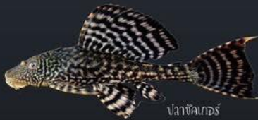
ปลาชดเกอ์

รบกวนหรือทำลายแหล่งที่อยู่อาศัย เช่น ปลาชดเกอ์ ซึ่งมีพฤติกรรมกัดไฟ้รในชวงฤดูวางไข่ จะทำให้สภาพตลิ่งพัง รมดีกุงเครย์ฟื้ชและหอยเชอ์มีผลกระทบต่อสิ่งคมพื้ชน้ำที่มีต้น ใบอ่อน โดยจะกัดกินทำลายจนหมด และเกิดการเปลี่ยนสิ่งคมพื้ชในแหล่งน้ำทำให้ความหลากหลายของชนิดสัตว์น้ำลดลง