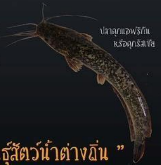
ปลาคูกแอฟริกันหรือคูก์สซีช

ก่อให้เกิดการปนเปื้อนทางพันธุกรรม สัตว์น้ำต่างถิ่นบางชนิดมีลักษณะทางพันธุกรรมที่ใกล้เคียงกับชนิดพันธุ์พื้นเมือง อาจมีการผสมพันธุ์กันทำให้เกิดลูกผสมทำให้ความหลากหลายทางพันธุกรรมเดิมเสื่อมลงหรือสูญพันธุ์ที่มีอัตราอดต่ำลง หรือเป็นกัมมันตรื้อนต่อไปได้ และอาจทำให้ชนิดพันธุ์เดิมสูญพันธุ์ไป เช่น ปลาคูกแอฟริกันหรือคูก์สซีช และลูกผสม (บีกอຍ) อาจทำให้เกิดการปนเปื้อนทางพันธุกรรมในปลาคูกอຍและปลาคูกดำ และกบพวรกอาจทำให้เกิดการปนเปื้อนทางพันธุกรรมในกบนา