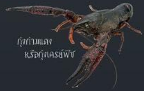
กุ้งก้ามแดงหรือกุ้งเครย์ฟื้ช

สัตว์น้ำต่างถิ่นบางชนิดเป็นพาหะนำโรคร้ายหรือปรสิต เมื่อเข้ามาสู่แหล่งน้ำของประเทศไทยแพร่โรคระบาดไปสู่สัตว์น้ำพื้นเมืองที่ไม่มีภูมิต้านทานได้ เช่น ปลารันเป็นพาหะของโรคแอนโอมสมและราพื้พื้ช, กุ้งก้ามแดงหรือกุ้งเครย์ฟื้ชเป็นพาหะนำโรค Crayfish plague, กบบางชนิดเป็นพาหะโรครื้อรา Chytridiomycosis, และสัตว์น้ำบางชนิดอาจนำพาพยาธิมาสู่มนุษย์ได้ เช่น หอยเชอ์