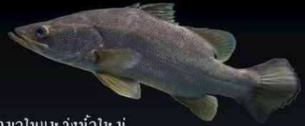
ปลากรงพวงม้าน้ำ

สัตว์น้ำต่างถิ่นที่รุกราน (AQUATIC INVASIVE SPECIES) คือ ชนิดพันธุ์สัตว์น้ำต่างถิ่นที่เข้ามาในแหล่งน้ำใหม่ แล้วปรับตัวเข้ากับสภาพแหล่งน้ำและสามารถตั้งถิ่นฐาน มีการแพร่กระจายได้ในธรรมชาติจนเพิ่มปริมาณอย่างรวดเร็วแทนที่สัตว์น้ำพื้นเมือง อาจทำให้ชนิดพันธุ์ท้องถิ่นหรือชนิดพันธุ์พื้นเมืองสูญพันธุ์ได้ ส่งผลคุกคามต่อความหลากหลายทางชีวภาพ ทั้งยังส่งผลกระทบต่อสมดุลนิเวศ และก่อให้เกิดความสูญเสียทางสิ่งแวดล้อม สัตว์นาမိး และเศรษฐกิจของประเทศ