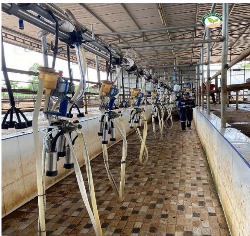
ภาพที่ 3 แสดงระบบรดน้ำแบบหลุม High Line