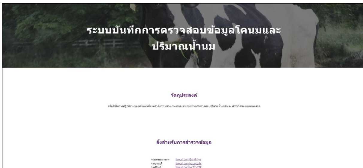
รูปภาพที่ 1

ขั้นตอนที่ 1 ให้ท่านเข้าระบบบันทึกการตรวจสอบข้อมูลโคนมและปริมาณน้ำนม โดยเข้าใช้งานที่ URL ที่ส่งให้ผู้ประสานของแต่ละจังหวัด