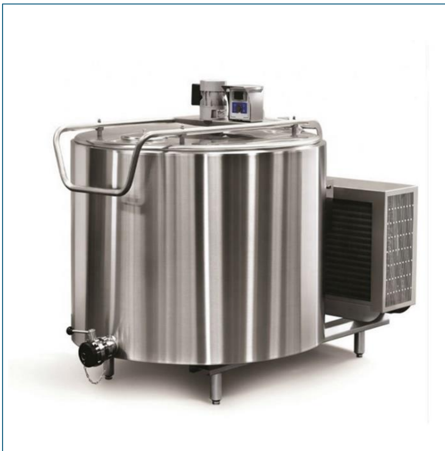
ภาพที่ 6 แสดงตัวอย่าง Farm Cooling Tank