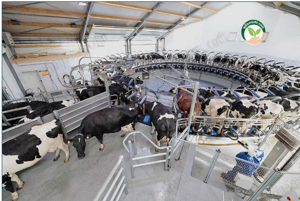
ภาพที่ 5 แสดงระบบรีดนมแบบวงกลม