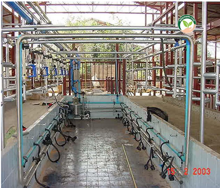
ภาพที่ 2 แสดงระบบรดน้ำแบบหลุม Low Line