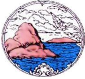
ตราประจำจังหวัด