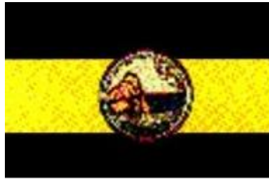
ธงประจำจังหวัดชลบุรี