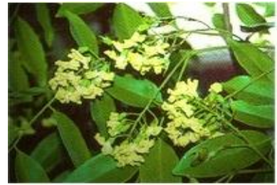
ดอกไม้ประจำจังหวัดชลบุรี

ตราจังหวัดชลบุรีเป็นรูปภูเขาอยู่ริมทะเล แสดงถึงสัญลักษณ์สำคัญ ๒ ประการของจังหวัด คือ “ทะเล” หมายถึง ความเป็นเมืองชายทะเลที่อุดมสมบูรณ์ และ “รูปภูเขาอยู่ริมทะเล” หมายถึง เขาสามมุขอันเป็นที่ตั้งของศาลเจ้าแม่สามมุขอันศักดิ์สิทธิ์ เป็นที่เคารพของชาวชลบุรี ตลอดจนประชาชนทั่วไป