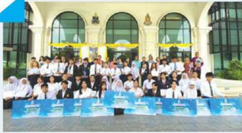
เยาวชนอาสาสานต่อพระราชดำริน้อมนำ 'องค์ความรู้' ขยายผลสู่ชุมชน > 8