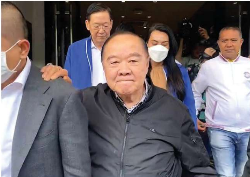
ปิดไมค์ - พล.อ.ประวิตร วงษ์สุวรรณ หัวหน้าพรรคพลังประชารัฐ เป็นประธานการประชุมกรรมการบริหารพรรค ได้เดินทางออกจากที่ทำการพรรค โดยได้อุ้มและแม้มปาก ปฏิเสธให้ความเห็นสื่อมวลชนที่พยายามสอบถามกรณีเสนอให้รัฐบาลยกเลิกเอ็มโอยู 44 ที่พรรคพลังประชารัฐ เมื่อวันที่ 12 พฤศจิกายน