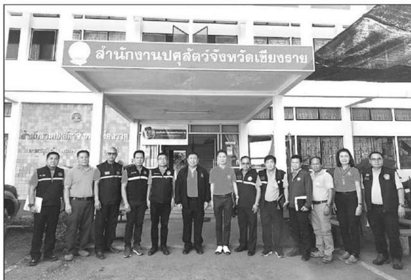
แก้ปัญหา : นายเศรษฐเกียรติ กระจ่างวงษ์ รองปลัดกระทรวงเกษตรและสหกรณ์ ลงพื้นที่ จ.เชียงราย เพื่อติดตามการแก้ปัญหาด้านภัยพิบัติ แผนการฟื้นฟูเยียวยา และให้ความช่วยเหลือเกษตรกรที่ประสบภัย ที่สำนักงานปศุสัตว์ จ.เชียงราย โดยพิจารณา ดำเนินการ 8 โครงการ แบ่งเป็น 3 กิจกรรม งบประมาณ 2,553,009,800 ล้านบาท

นอกจากนี้ รองปลัดฯ ได้แจ้งที่ประชุมทราบถึงการเดินทางลงพื้นที่ อ.แม่สาย จ.เชียงรายใหม่ ของ รมว.เกษตรฯ และคณะ เพื่อเยี่ยมเยียนเกษตรกรและติดตามการฟื้นฟูเยียวยาภายหลังประสบภัย โดยขอให้ทาง จ.เชียงราย ร่วมกิจกรรมและสนับสนุนข้อมูลการลงพื้นที่ดังกล่าว เนื่องจากเป็นพื้นที่ใกล้เคียง พร้อมทั้งได้สั่งการให้หน่วยงานในพื้นที่เตรียมความพร้อมสำหรับจัดการประชุมกรม.สัญจร ในเขตกลุ่มจังหวัดภาคเหนือตอนบน ระหว่างวันที่ 24-26 พฤศจิกายนนี้