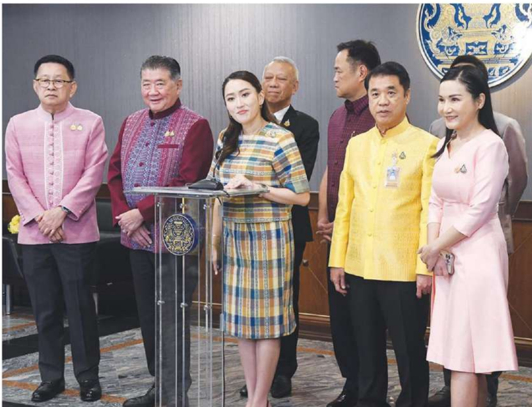
🏠 ช่วยประชาชน - น.ส.แพทองธาร ชินวัตร นายกรัฐมนตรี นำคณะรัฐมนตรีแถลงภายหลังประชุม ครม. โดยชี้แจงถึงมาตรการช่วยเหลือประชาชนหลายเรื่องทั้งนี้ส่น จ่ายเงินช่วยชาวนา เยียวยากลุ่มเปราะบาง เป็นต้น ที่ทำเนียบรัฐบาล เมื่อวันที่ 11 ธ.ค.