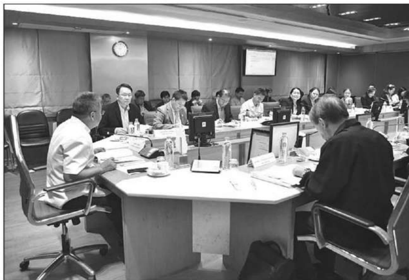
ถกคกก. : นายอภัย สุทธิสังข์ รองปลัดกระทรวงเกษตรและสหกรณ์ ประชุมคณะกรรมการโคนมและผลิตภัณฑ์นม ครั้งที่ 5/2567 มีเรื่องที่สำคัญในที่ประชุม 8 เรื่อง อาทิ การติดตามความก้าวหน้ายุทธศาสตร์พัฒนาโคนมและผลิตภัณฑ์นม มาตรฐานการรับซื้อน้ำนม และ การเสนอปรับปรุงกฎหมายที่เกี่ยวข้อง

เลี้ยงสัตว์ (นบพพ.) ครั้งที่ 2/2567 มีเรื่องที่สำคัญในที่ประชุม ดังนี้ 1.ความคืบหน้าการเสนอมาตรการรักษาเสถียรภาพราคาและส่งเสริมการผลิตข้าวโพดเลี้ยงสัตว์ ปี 2567/68 และ 2.มาตรการควบคุมการนำเข้าข้าวสาลีสำหรับกลุ่มผู้ผลิตอาหารกึ่ง ปี 2568 ทั้งนี้ ที่ประชุมมีมติ ยกเว้นมาตรการควบคุมการนำเข้าข้าวสาลีสำหรับผลิตอาหารกึ่ง สำหรับปี 2568 ของผู้ผลิตอาหารกึ่ง 6 ราย ปริมาณข้าวสาลีที่ขอยกเว้น 118,700 ตัน และมอบหมายให้กระทรวงพาณิชย์ ในฐานะฝ่ายเลขานุการ นบพพ.รายงานความก้าวหน้าในการประชุมครั้งต่อไป