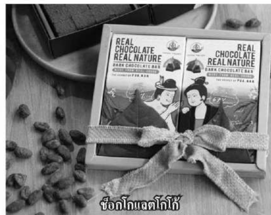
ช็อกโกแลตโกโก้

อาทิ โรงแรม ร้านอาหาร และสปา เป็นต้น และสามารถพัฒนาผลิตภัณฑ์ที่เป็นอัตลักษณ์ได้สอดคล้องกับความต้องการตลาด เช่น เครื่องสำอาง เครื่องดื่มสำเร็จรูป คราฟต์ช็อกโกแลต