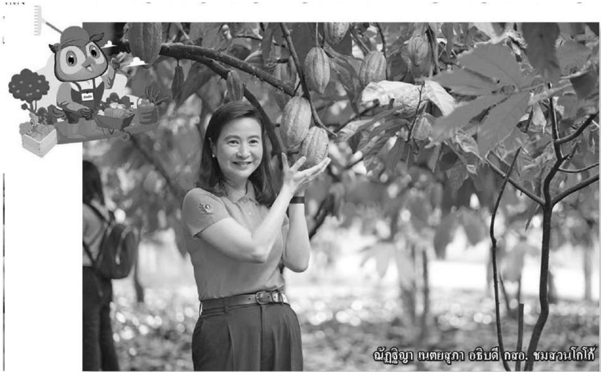
ณัฐจิฎา เนตยสุภา อธิบดีกรมส่งเสริมการค้าระหว่างประเทศฯ ชมสวนโกโก้

ยกระดับประเทศไทยสู่ศูนย์กลางอุตสาหกรรมโกโก้ในอาเซียน ตามนโยบายของนายเอกนัฏ พร้อมพันธุ์ รมว.อุตสาหกรรม ที่มอบหมายให้กรมส่งเสริมการค้าระหว่างประเทศ (กสอ.) หรือ ดีพร้อม