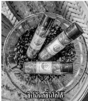
ลิปบาล์มอินโกโก้

หัวข้อข่าว: ดันโกโก้นานชอฟต์ฟาวเวอร์ พัฒนาสินค้าความงาม-สุขภาพพรีเมียม