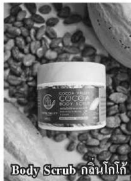
Body Scrub กลิ่นโกโก้

นายฉัฐพล รังสิตพล ปลัดกระทรวงอุตสาหกรรม พาลงพื้นที่เยี่ยมชมความสำเร็จของ 'โกโก้วัลเลย์' ต้นแบบธุรกิจโกโก้ครบวงจร