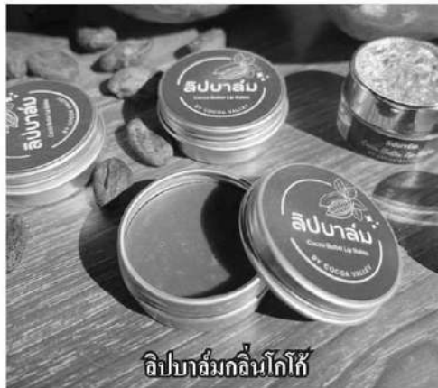
ลิปบาล์มอินโกโก้