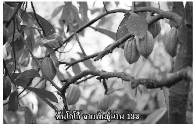
ต้นโกโก้ ฉายพันธุ์น่าน 133

ดังเช่นที่ไทยเคยประสบความสำเร็จกับอุตสาหกรรมกาแฟมาแล้ว จึงเห็นโอกาสเพิ่มมูลค่าของโกโก้ในรูปแบบของสินค้าและบริการ ด้วยความโดดเด่นในเชิงคุณภาพ อัตลักษณ์ทางรสชาติ หลีกเลี่ยงการแข่งขันในเชิงปริมาณ