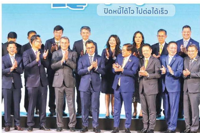
แก้หนี้ - นายพิชัย ชุนหวทวิธ รองนายกรัฐมนตรีและรัฐมนตรีว่าการกระทรวงการคลัง พร้อมด้วย นายเศรษฐพุฒิ สุทธิวาทนฤพุฒิ ผู้ว่าการธนาคารแห่งประเทศไทย (ธปท.) และผู้เกี่ยวข้อง แถลงโครงการ "คุณสู้ เราช่วย" วางแผนช่วยลูกหนี้ "บ้าน-รถ-เอสเอ็มอี" รวม 2.3 ล้านราย วงเงินรวม 1.31 ล้านล้านบาท พักดอกเบี้ย 3 ปี เมื่อวันที่ 11 ธันวาคม

น.ส.แพทองธารกล่าวว่า นอกจากนั้น สถาบันการเงินเฉพาะกิจ ได้มีมาตรการช่วยเหลือลูกหนี้กลุ่มเปราะบาง ทั้งลูกหนี้ที่มีประวัติชำระหนี้ดี เพื่อให้มีกำลังใจ รักษาวิสาหกรรมการคลังต่อไป และลูกหนี้ที่มีปัญหาการชำระหนี้เรื้อรัง จะมีมาตรการการช่วยเหลือลูกหนี้