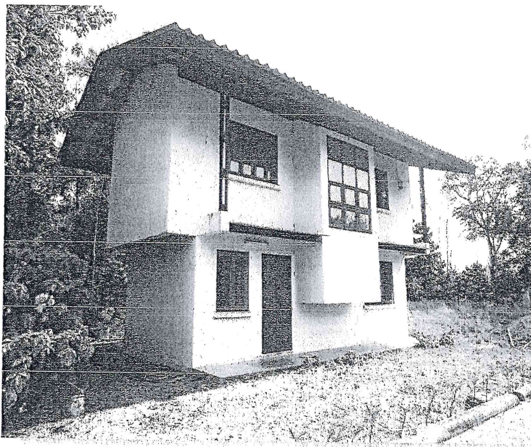
บ้านพักคนงานภายในโครงการอนุรักษ์ฯ