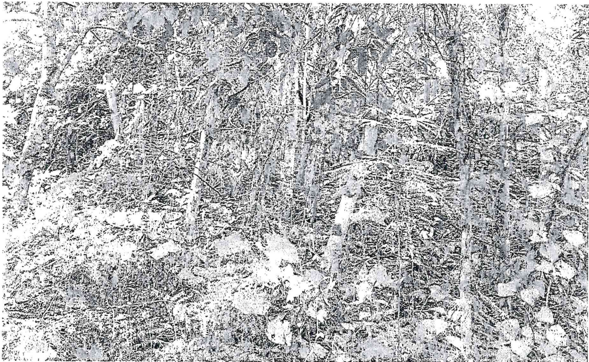
รื้อลวดหนามด้านหลังโครงการอนุรักษ์ฯ