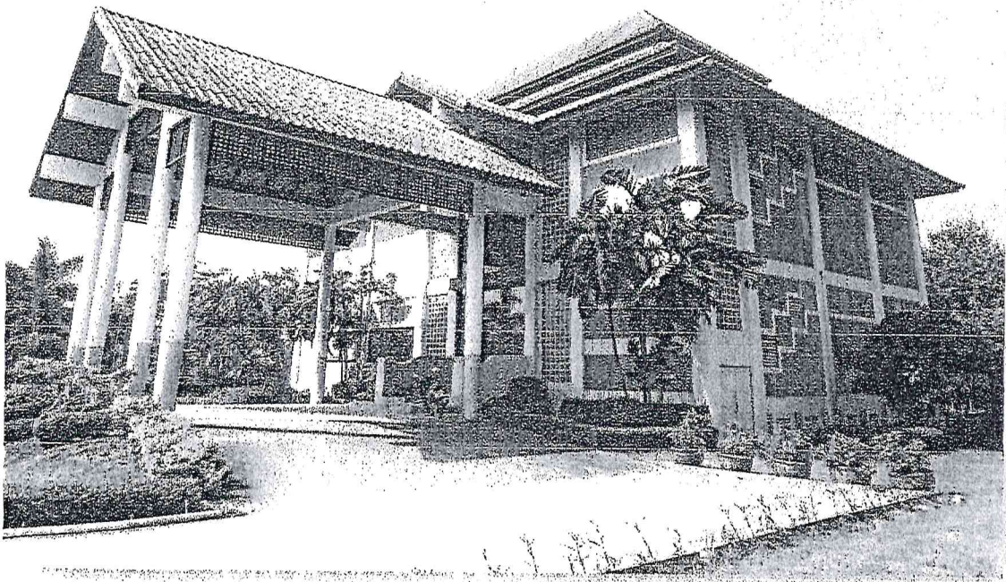
อาคารสำนักงานโครงการอนุรักษ์ฯ พื้นที่ ๑,๙๔๕ -๓-๖๔ ไร่ หมู่ที่ ๕,๖ ตำบลสลู และหมู่ที่ ๔,๗ ตำบลสองพี่น้อง อำเภอกำแพง จังหวัดชุมพร