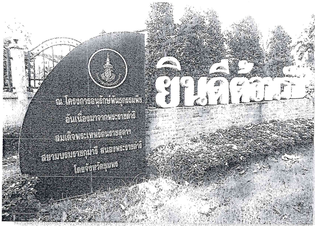
ป้ายโครงการอนุรักษ์ฯ บริเวณด้านหน้าโครงการ