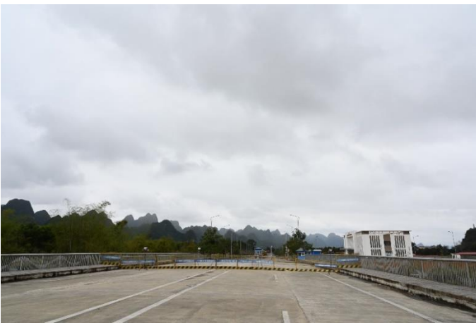
สะพานข้ามแม่น้ำดั่งกั๋วแห่งที่ 2 มีช่องทางเดินรถบรรทุกเข้า-ออกระหว่างจีนและเวียดนาม 4 ช่องจราจร (เข้า 2 ออก 2)

3.3 โครงสร้างตัวสะพานเชื่อมระหว่างด้านสุขุ่ยโข้วสะพานแห่งที่ 2 ของจีนกับด่าน Ta Lung ของเวียดนาม มีช่องทางเดินรถบรรทุกเข้า-ออกระหว่างกัน 4 ช่องจราจร (สะพานยาว 90 ม.) เมื่อรถผ่านสะพานข้ามมายังฝั่งจีน มีช่องไม้กั้นในการตรวจสอบรถบรรทุกเข้า-ออก รวม 14 ช่อง โดยเป็นไม้กั้นช่องทางขาเข้า 9 ช่อง และช่องทางขาออก 5 ช่อง สามารถรองรับรถบรรทุกเข้า-ออกได้กว่า 1,500 คัน และหากมีการขยายพื้นที่ลานตรวจสอบสินค้าเพิ่มขึ้นก็จะสามารถรองรับรถเข้า-ออกได้มากถึง 2,500 คัน ในอนาคต ซึ่งจุดเด่นของด้านสุขุ่ยโข้วคือสภาพภูมิประเทศเป็นที่ราบและมีพื้นที่ใช้สอยได้อีกจำนวนมาก ซึ่งต่างจากด่านโหย่วอี๋กวนซึ่งเป็นมีสภาพภูมิประเทศเป็นภูเขา พื้นที่จึงมีจำกัด โดยด้านสุขุ่ยโข้วสะพานแห่งที่ 2 เป็นด่านที่มีจุดตรวจรถเข้า-ออกที่ใหญ่ที่สุดของเขตฯ กว่างซีจ้วง