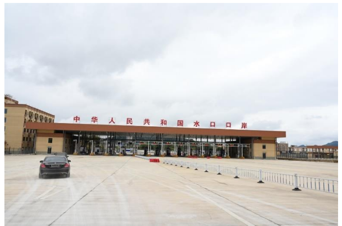
ด้านสุขุ่ยโข้ว สะพานแห่งที่ 2 มี 14 ช่องไม้กั้นรองรับการเข้า-ออก ของรถ 14 คัน (9 เข้า 5 ออก)

3.4 ปัจจุบันด้านสุขุ่ยโข้วที่ใช้งานคือด้านสุขุ่ยโข้วสะพานแห่งที่ 1 ซึ่งรองรับทั้งการเดินทางเข้า-ออกของผู้โดยสารและรถบรรทุกสินค้า (เมื่อด้านสุขุ่ยโข้วสะพานแห่งที่ 2 ผ่านการตรวจรับจากหน่วยงานระดับชาติ และมีการแลกเปลี่ยนเอกสารข้อตกลงระหว่างจีนและเวียดนาม จึงจะสามารถเปิดใช้งานได้ เมื่อเปิดใช้งานรถบรรทุกสินค้าจะเปลี่ยนมาใช้ด้านสุขุ่ยโข้วสะพานแห่งที่ 2 ในขณะที่ด้านสะพานแห่งที่ 1 จะรองรับการเดินทางเข้า-ออกของผู้โดยสารเท่านั้น) ทั้งนี้ ด้านสุขุ่ยโข้วสะพานแห่งที่ 1 มีการเปิดใช้งานสถานที่ควบคุมตรวจสอบจำเพาะผลไม้นำเข้าเมื่อวันที่ 13 สิงหาคม 2562 ซึ่งพบว่ามีการนำเข้าผลไม้จากประเทศเวียดนามเพิ่มขึ้นอย่างต่อเนื่อง จาก 20,000 ตัน ในปี 2563 เพิ่มขึ้นเป็น 90,000 ตัน ในปี 2566 โดยมีการนำเข้าผลไม้เวียดนามผ่านด้านสุขุ่ยโข้วจำนวน 3,287 ล็อต ปริมาณ 92,000 ตัน มูลค่ากว่า 825 ล้านบาท เป็นขนุน ทุเรียน แก้วมังกร และมะม่วง