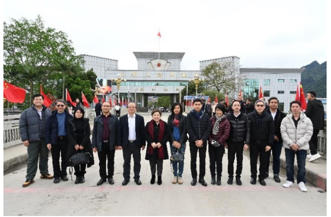
ด่านสุ่ยโข่ว สะพานแห่งที่ 1 ช่องทางเดินรถบรรทุกทุกเข้า-ออก ระหว่างจีนและเวียดนาม 2 ช่องจราจร (เข้า 1 ออก 1)