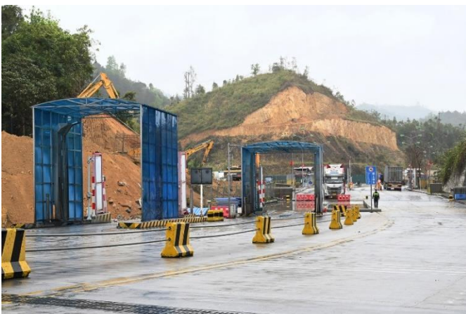
ช่องทางเดินรถบรรทุกเข้า-ออกระหว่างจีนและเวียดนาม 4 ช่องจราจร (เข้า 2 ออก 2) และอยู่ระหว่างการปรับปรุงพื้นที่ด้านซ้ายมือเพื่อขยายช่องจราจรเพิ่มอีก 2 ช่อง

2.4 เมื่อวันที่ 23 กุมภาพันธ์ 2567 จีนและเวียดนามได้เริ่มดำเนินโครงการขยายช่องทางเดินรถบรรทุกเข้า-ออกระหว่างประเทศบริเวณเส้นหลักเขตแดน 1119 - 1120 ระหว่างด่านโหย่วอี้กวนของจีน และด่านหุหงิงของเวียดนามจากปัจจุบัน 4 ช่องจราจร เป็น 6 ช่องจราจร ซึ่งจะช่วยให้การนำเข้าและส่งออกสินค้าระหว่างกันสะดวกและมีปริมาณเพิ่มขึ้น ยกกระดับประสิทธิภาพการผ่านเข้า-ออกด้านของรถบรรทุก และช่วยให้ห่วงโซ่อุตสาหกรรมและห่วงโซ่อุปทานระหว่างจีนและเวียดนามมีเสถียรภาพเพิ่มขึ้น ซึ่งคาดว่าจะแล้วเสร็จในกลางปีนี้ และในอนาคตมีแผนขยายช่องทางเดินรถระหว่างจีนและเวียดนามเป็น 14 ช่องจราจร (7 เข้า 7 ออก) เวลาเปิดทำการของด่านโหย่วอี้กวนตั้งแต่ 08.00 - 19.00 น. (เวลาจีน) ในช่วงใดที่มีรถบรรทุกจำนวนมากทางด้านฝั่งจีนและเวียดนามก็จะมีการขยายระยะเวลาในการปิดด่านออกไป ซึ่งในอนาคตหากการพัฒนาด่านอัจฉริยะระหว่างด่านโหย่วอี้กวนและด่านหุหงิงฝั่งเวียดนามแล้วเสร็จก็จะสามารถรองรับการนำเข้าส่งออกสินค้าได้ 24 ชั่วโมง