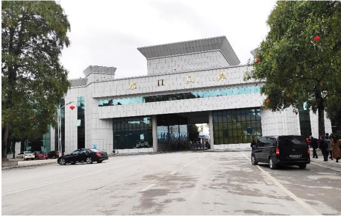
ด่านสุ่ยโข่ว สะพานแห่งที่ 1