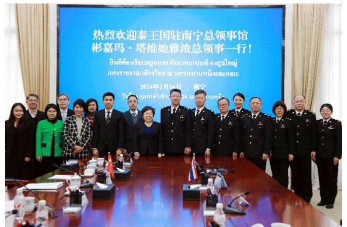
การประชุมหารือกับผู้บริหารศุลกากรหนานหนิง

1.1 คณะผู้แทนฝ่ายไทยเข้าพบหารือกับศุลกากรหนานหนิงในประเด็นเรื่องการอำนวยความสะดวกในการนำเข้าผลไม้ของไทยในช่วงฤดูการผลิต ปี 2567 และติดตามสถานการณ์ด้านต่าง ๆ ในการนำเข้าสินค้าเกษตรจากประเทศไทยของเขตปกครองตนเองกว่างซีจ้วง ซึ่งศุลกากรหนานหนิงได้ให้ความสำคัญกับการประชุมหารือในครั้งนี้เป็นอย่างมาก โดยอธิบดีได้เข้าร่วมการประชุมด้วยตนเอง (ที่ผ่านมามีส่วนใหญ่มอบหมายระดับรองอธิบดี)