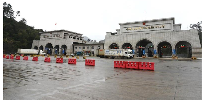
ด่านโหย่วอี้กวน มี 2 อาคาร แต่ละอาคาร มี 6 ช่องไม้กั้น รองรับ การเข้า-ออกของรถบรรทุก 6 คัน (3 เข้า 3 ออก) โดยอาคาร 2 (ขวามือ) อยู่ระหว่างการตรวจรับจากหน่วยงานระดับชาติ