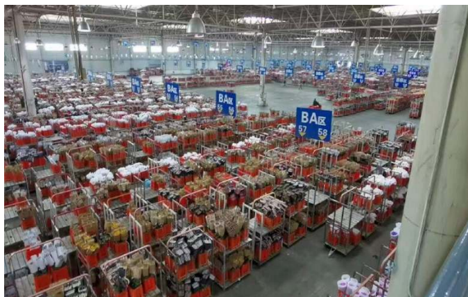
โกดังจัดดอกไม้ที่เตรียมประมูล

KIFA ได้ใช้เทคโนโลยีการจัดการกับระบบการประมูลจากประเทศเนเธอร์แลนด์ เพื่อให้ระบบการประมูลทันสมัยครบวงจร และมีมาตรฐานสากลเทียบเคียงกับยุโรป ดังเช่นตลาดประมูลอัลชเมียร์ ตลาดประมูลดอกไม้ในเนเธอร์แลนด์ที่ใหญ่ที่สุดในโลก ทั้งนี้ เพื่อให้สอดคล้องกับฉายา “อัลชเมียร์แห่งทิศตะวันออก”