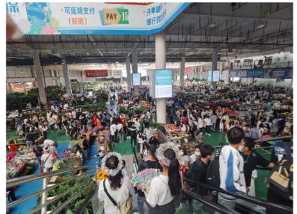
ตลาดค้าส่งดอกไม้ไต้หวันนครคุนหมิง

นครคุนหมิงมีตลาดค้าส่งดอกไม้ไต้หวัน (斗南花卉市场) ซึ่งเป็นตลาดค้าส่งดอกไม้ที่ใหญ่ที่สุดในเอเชีย ภายในตลาดไต้หวันมีบริษัทศูนย์กลางการค้าและการประมูลดอกไม้นานาชาตินครคุนหมิง (Kunming International Flora Auction Trading Center: KIFA 昆明国际花卉拍卖交易中心有限公司) มีการจัดประมูลดอกไม้ที่มาจากทุกสารทิศ ทั้งจากจีนและต่างประเทศ