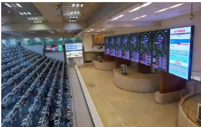
ห้องประมูลดอกไม้ของ KIFA

KIFA เป็นตลาดประมูลดอกไม้ที่ใหญ่เป็นอันดับ 1 ของเอเชีย อันดับ 2 ของโลก เปิดดำเนินการเมื่อปี 2545 เป็นกิจการรัฐวิสาหกิจที่มีเอกชนลงทุนร้อยละ 51 และภาครัฐร้อยละ 49 โดยเฉลี่ยมีการประมูลดอกไม้วันละ 4.0 - 4.5 ล้านดอกต่อวัน มูลค่าวันละมากกว่า 4.8 ล้านบาท โดยช่วงสูงสุดมีการประมูลวันละกว่า 9.31 ล้านบาท