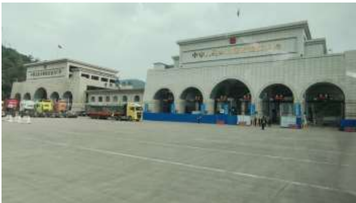
ช่องทางเข้าออกเก่าของด่านโหย่วอี๋กวนอยู่ทางด้านซ้าย และช่องทางเข้าออกใหม่อยู่ทางด้านขวา หลังจากเปิดใช้งาน ช่องทางใหม่จะให้ช่องทางเก่าเป็นช่องทางขาออกจีน และช่องทางใหม่เป็นช่องทางขาเข้าจีน