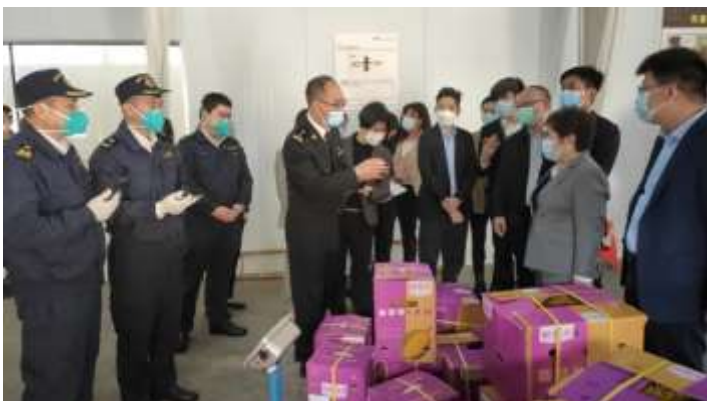
คณะดูการตรวจสอบกักกันทุเรียนที่นำเข้าจากไทยผ่านด่านโหย่วอี๋กวน