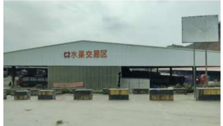
ตลาดการค้าผลไม้จีน-อาเซียน ผิงเสียง