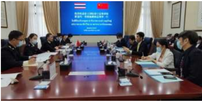
การพบหารือกับผู้บริหารศุลกากรหนานหนิง