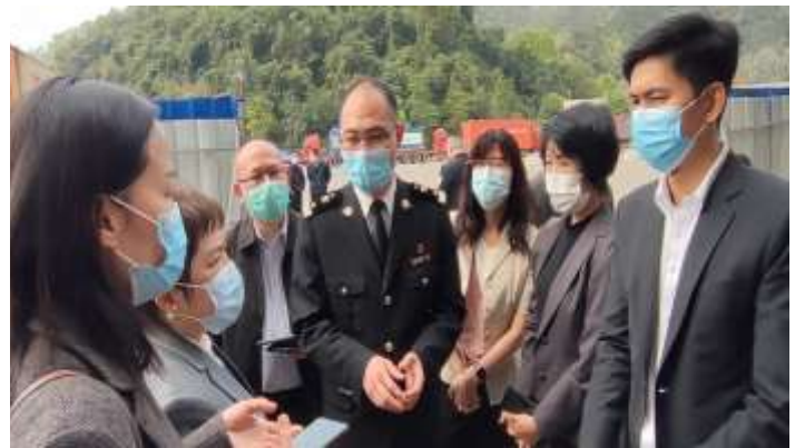
คณะแลกเปลี่ยนกับรองผู้อำนวยการศุลกากรโหย่วอี๋กวน