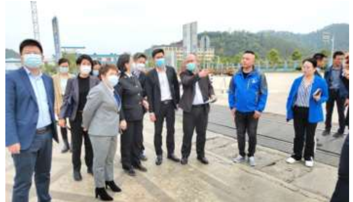
รับฟังสถานการณ์การนำเข้าผลไม้ไทย ณ ตำนรถไฟผิงเสียง