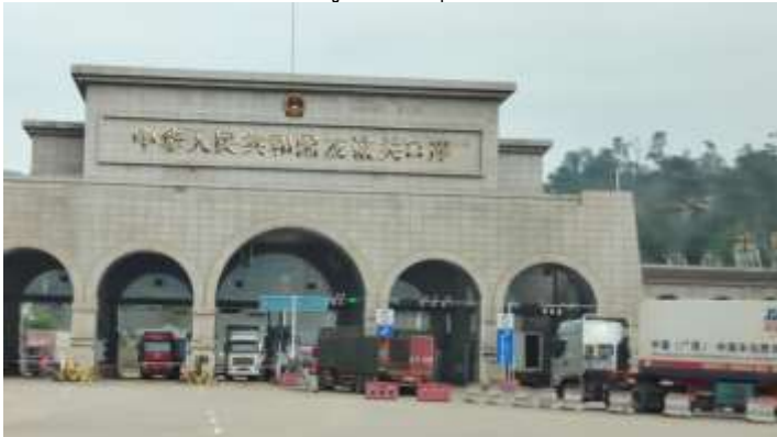
ช่องทางเข้า-ออกเก่าของด่านโหย่วอี๋กวน