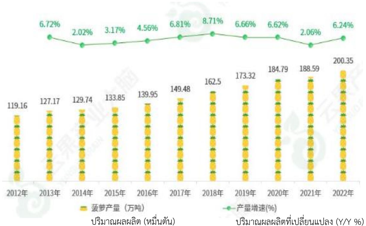
ปริมาณผลผลิตสับปะรดของจีน ปี 2555 - 2565 (ค.ศ. 2012 - 2022)

ประเทศจีนมีพื้นที่เพาะปลูกสับปะรดราว 416,667 ไร่ โดยมีพื้นที่เพาะปลูกหลักอยู่ในมณฑลกว่างตุง 244,708 ไร่ มณฑลไห่หนาน 99,083 ไร่ มณฑลยูนนาน 48,750 ไร่ เขตปกครองตนเองกว่างซีจ้วง 19,208 ไร่ และมณฑลฝูเจี้ยน 6,458 ไร่