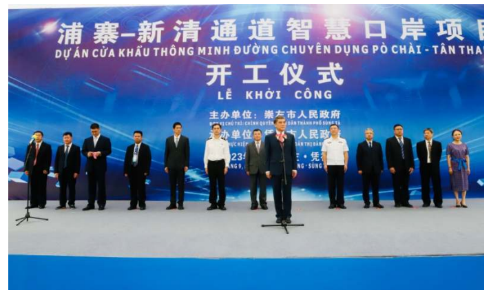
พิธีเปิดการก่อสร้างด่านอัจฉริยะบริเวณช่องทางผู้จ่าย-Tan Thanh (ด่านประเพณีสำหรับการค้าของชาวชายแดนเมืองฝิงเสียง)