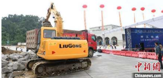
การเริ่มก่อสร้างด่านอัจฉริยะจีน-เวียดนาม (ด่านโหย่วอ๊กวน-ด่าน Huu Nghi)