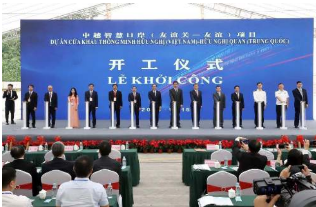
พิธีเปิดการก่อสร้างด่านอัจฉริยะจีน-เวียดนาม (ด่านโหย่วอ๊กวน-ด่าน Huu Nghi) เมืองฝิงเสียง

โครงการก่อสร้างด่านอัจฉริยะจีน-เวียดนาม (ด่านโหย่วอ๊กวน-ด่าน Huu Nghi) เป็นโครงการความร่วมมือระหว่างจีนและเวียดนามในการสร้างช่องทางขนส่งสินค้าข้ามแดนอัจฉริยะ และเป็นโครงการด่านอัจฉริยะโครงการแรกระหว่างจีนกับเวียดนาม