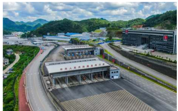
ช่องทางขนส่งสินค้าของด่านหลงปัง