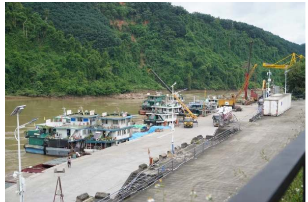
ท่าเรือกวนเหล่ย์