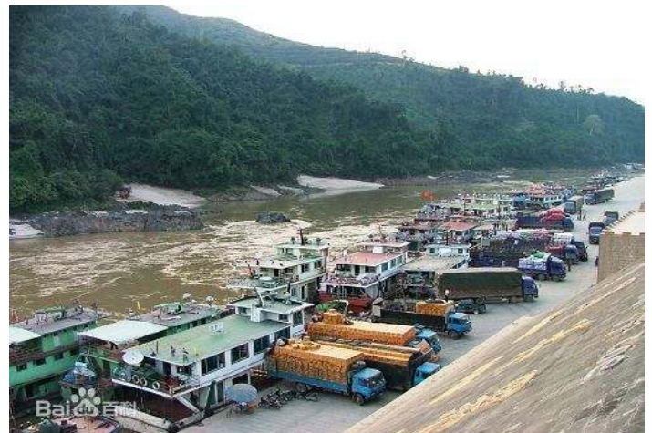
การขนถ่ายสินค้าที่ท่าเรือกวนเหล่