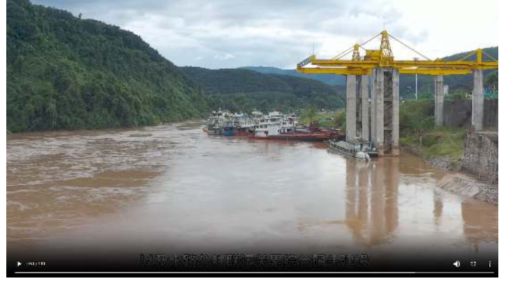
ท่าเรือกวนเหล่ย์