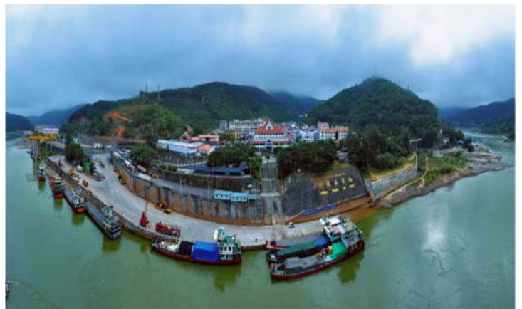
ท่าเรือกวเหล่