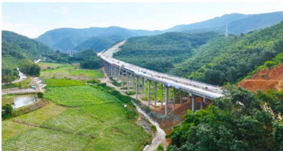
เส้นทางด่วนเหมิงหย่วน-กวนเหล่ย์

๑. เส้นทางด่วนเหมิงหย่วน-กวนเหล่ย์ เป็นเส้นทางด่วน ๔ ช่องจราจร ที่เชื่อมด่านท่าเรือกวนเหล่ย์ กับโครงข่ายทางด่วนคุนหมิง-โมฮาน (G8511) ที่จุดขึ้นลงทางด่วนเหมิงหย่วน มูลค่าการลงทุนรวม ๔,๖๘๘ ล้านดอลลาร์ เริ่มก่อสร้างเมื่อวันที่ ๓๐ เมษายน ๒๕๖๔ มีระยะทางหลักยาว ๒๙.๘๐๗ กม. โดยเป็นเส้นทางด่วน ระยะทาง ๒๔.๖๑๓ กม. สามารถใช้ความเร็วได้ไม่เกิน ๘๐ กม./ชม. เส้นทางหลวงระดับ ๑ ระยะทาง ๓.๒๐๗ กม. และเส้นทางหลวงระดับ ๒ ระยะทาง ๑.๙๙ กม. สามารถใช้ความเร็วได้ไม่เกิน ๖๐ กม./ชม. โดยมีการสร้างช่องทางเปลี่ยนถ้ำยรถบรรทุกยาว ๐.๕๑๓ กม. มีจุดตัดของเส้นทาง ๒ แห่ง ที่เหมิงหย่วนและกวนเหล่ย์ ลานจอดรถ ๑ แห่ง จุดเก็บเงินค่าผ่านทางเส้นทางหลัก ๑ แห่ง จุดเก็บเงินค่าผ่านทางเส้นทางแยก ๑ แห่ง ตลอดเส้นทางเป็นโครงสร้างสะพานและอุโมงค์ ร้อยละ ๔๘.๖๙