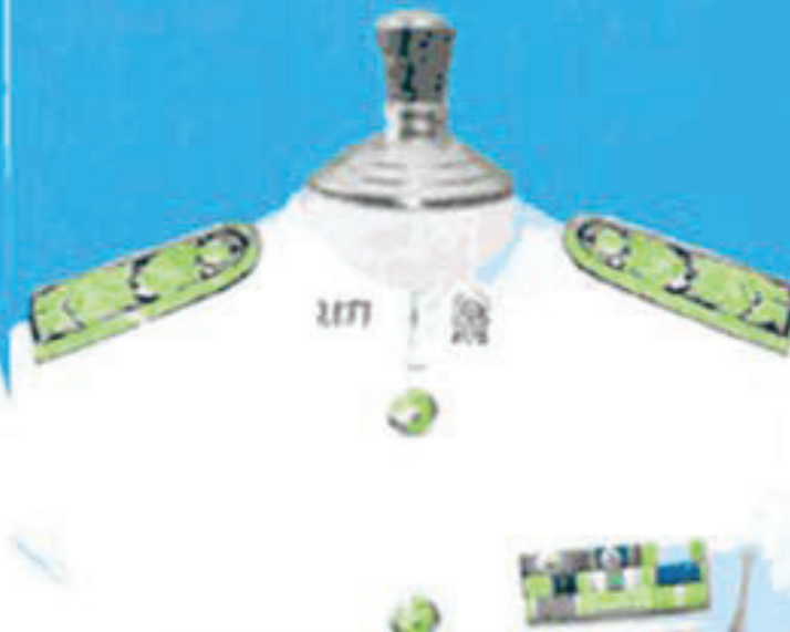
ตัวอย่าง การแต่งกายข้าราชการชาย