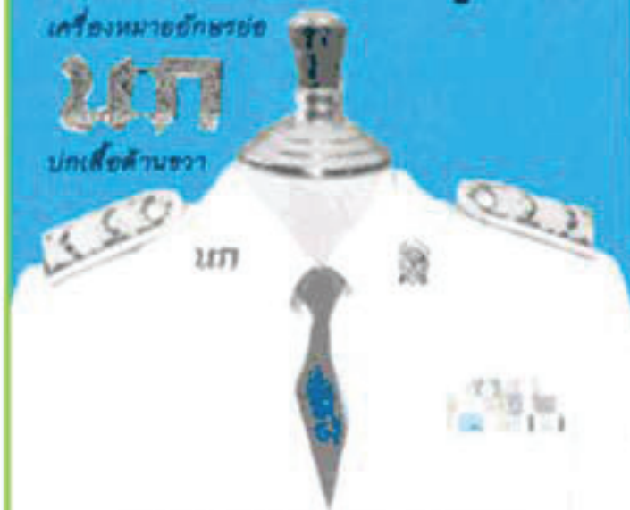
ตัวอย่าง การแต่งกายข้าราชการหญิง