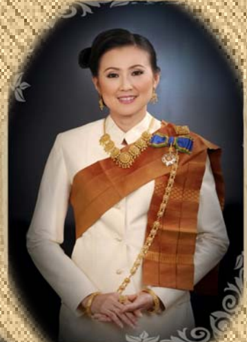
นางสาว... ... ...