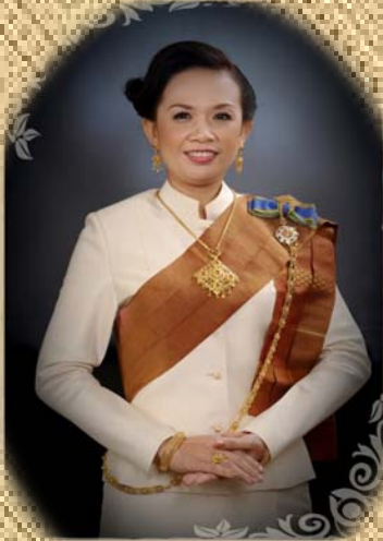
นางสาว... ... ...