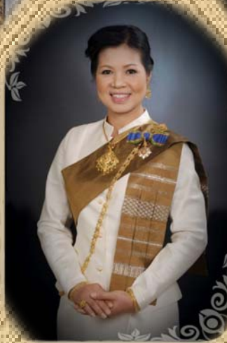
นางสาว... ... ...