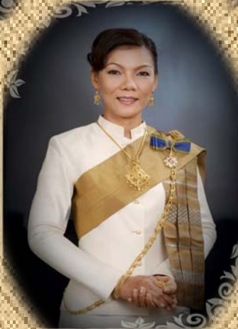
นางสาว... ... ...