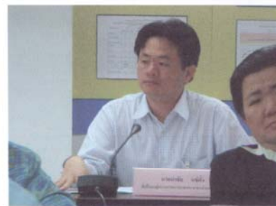
↑ ที่ปรึกษาภาคประชาชน