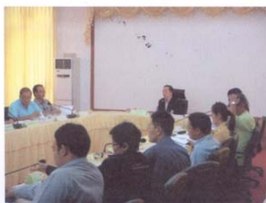
ที่ปรึกษาภาคประชาชน