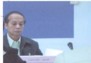
↑ ที่ปรึกษาภาคประชาชน