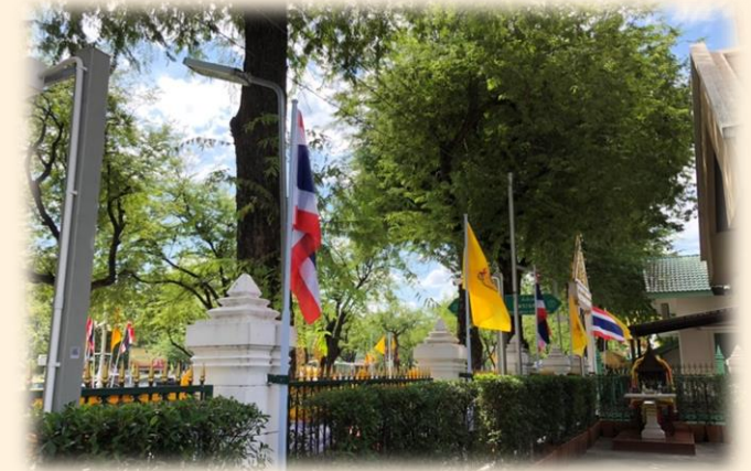
การประดับธงชาติ และธงพระปรมาภิไธย ของแต่ละพระองค์