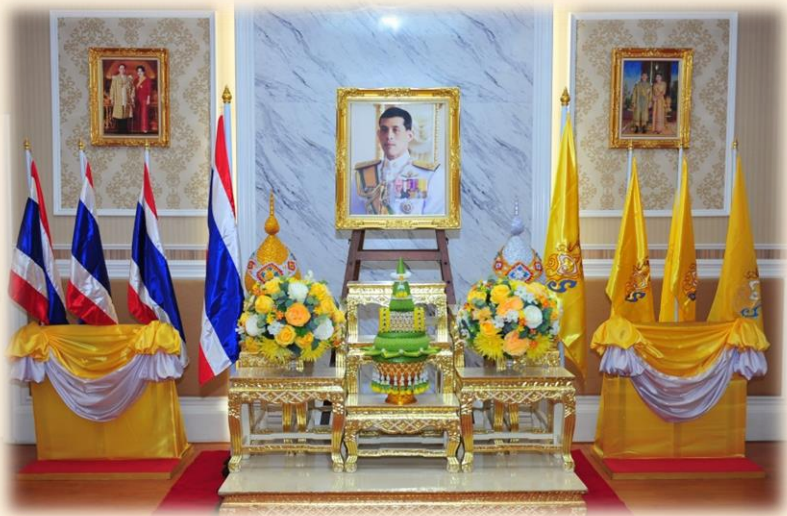
การตั้งโต๊ะหมู่ประดิษฐานพระบรมฉายาลักษณ์ พร้อมเครื่องสักการะ และการจัดโต๊ะลงนามถวายพระพร