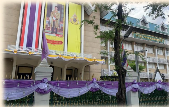
การประดับตกแต่งป้ายระฆังตามสี ของวันพระราชสมภพของแต่ละพระองค์