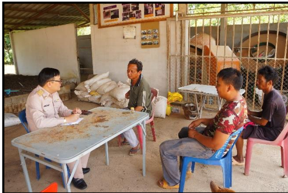
ภาพกิจกรรมกลุ่มปุ๋ยอินทรีย์เคมีชีวภาพบ้านหนองบัวคำ

๒. สถานีพัฒนาที่ดินลำพูน ส่งเสริมและสนับสนุนในรูปแบบศูนย์เรียนรู้ดินปุ๋ยชุมชน