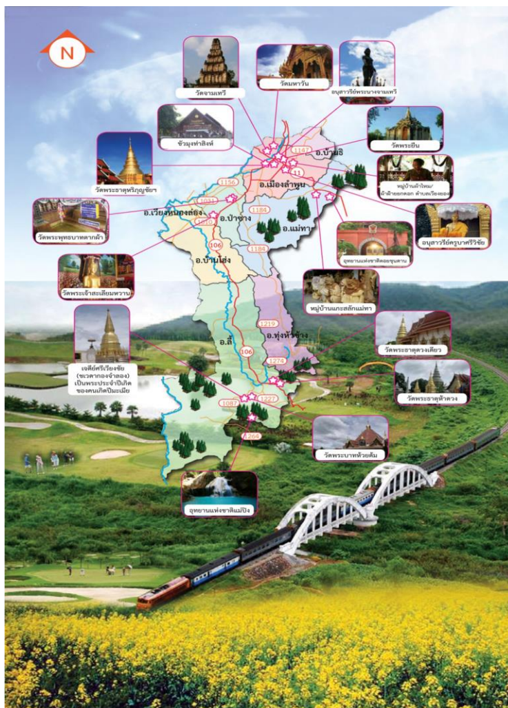
แผนภาพที่ ๑ แผนที่แสดงแหล่งท่องเที่ยวในจังหวัดลำพูน