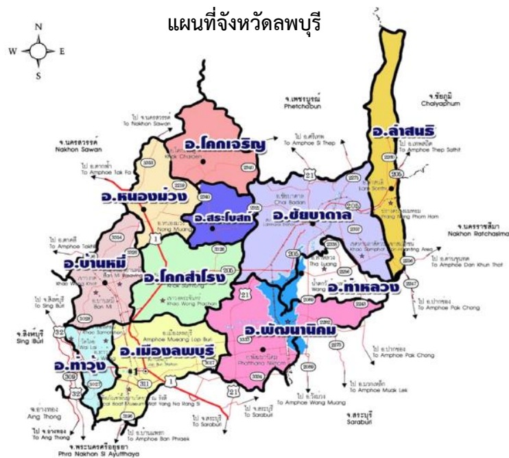
รูปที่ ๑ แผนที่จังหวัดลพบุรี

ทิศตะวันตก ติดต่อกับ อำเภอเมืองสิงห์บุรีและอำเภอพรมบุรี จังหวัดสิงห์บุรี อำเภอไชโย จังหวัดอ่างทอง และอำเภอดากฟ้า จังหวัดนครสวรรค์