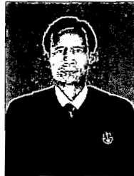
นายประเวศ รัชชพล อธิบดีศาลปกครองกลาง