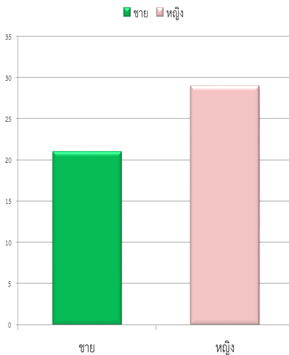
ภาพที่ 1 จำนวนผู้ตอบแบบสอบถาม

ผู้ตอบแบบสอบถามที่เข้าร่วมโครงการคลินิกเกษตรเคลื่อนที่ ครั้งที่ 2 ประจำปีงบประมาณ พ.ศ. 2567 ส่วนใหญ่เป็นเพศหญิง จำนวน 29 ราย คิดเป็นร้อยละ 58.00 และเพศชาย จำนวน 21 ราย คิดเป็นร้อยละ 42.00 ตามลำดับ