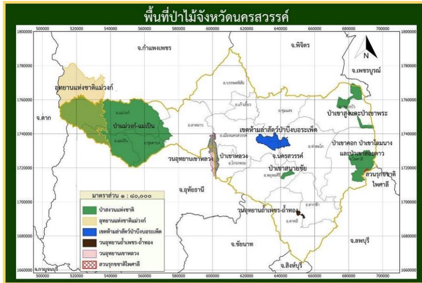
พื้นที่ป่าสงวนแห่งชาติจังหวัดนครสวรรค์

จังหวัดนครสวรรค์ มีพื้นที่ ๕,๙๕๓,๕๑๗.๗๓ ไร่ ในปี พ.ศ. ๒๕๖๔ จังหวัดนครสวรรค์มีพื้นที่ป่าไม้จากการแปลตีความโดยใช้ข้อมูลภาพจากถ่ายดาวเทียม Sentinel - ๒ และดาวเทียม Landsat ๘ เป็นเนื้อที่ ๕๘๐,๕๗๕.๕๑ ไร่ คิดเป็นร้อยละ ๙.๗๕ ของพื้นที่จังหวัดนครสวรรค์ (สำนักจัดการที่ดินป่าไม้, กรมป่าไม้) ซึ่งประกอบด้วยพื้นที่ป่าสงวนแห่งชาติ จำนวน ๗ พื้นที่ เนื้อที่รวมทั้งสิ้น ๓๖๔,๙๕๗.๘๗ ไร่ และพื้นที่ป่าอนุรักษ์ (อุทยานแห่งชาติ เขตห้ามล่าสัตว์ป่า ฯลฯ) จำนวน ๕ พื้นที่ เนื้อที่รวมทั้งสิ้น ๓๙๓,๑๕๘ ไร่