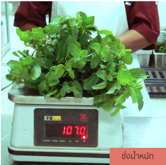
ชั่งน้ำหนัก

รวมทั้งปรับบทกำหนดโทษกรณีตรวจพบปัญหา ด้านความปลอดภัยอาหาร โดยแจ้งเตือนนับครั้งแยกเป็น ปัญหาด้านเชื้อจุลินทรีย์ สารเคมี พืชตัดแปรพันธุกรรม หรือสิ่งอื่นใดที่เป็นอันตรายต่อสุขภาพมนุษย์เนื่องจากสาเหตุของปัญหา แนวทางการแก้ไข และวิธีการจัดการ ความปลอดภัย มีความแตกต่างกัน นอกจากนี้มีการ กำหนดกรอบระยะเวลาของพนักงานเจ้าหน้าที่ในการ พิจารณาแนวทางการปรับปรุงแก้ไขของโรงงานผลิต สินค้าพืช เพื่อยกเลิกการระงับหนังสือสำคัญแสดง การขึ้นทะเบียนโรงงานผลิตสินค้าพืช เพื่อให้มีการ ดำเนินการที่รวดเร็วอย่างมีประสิทธิภาพ