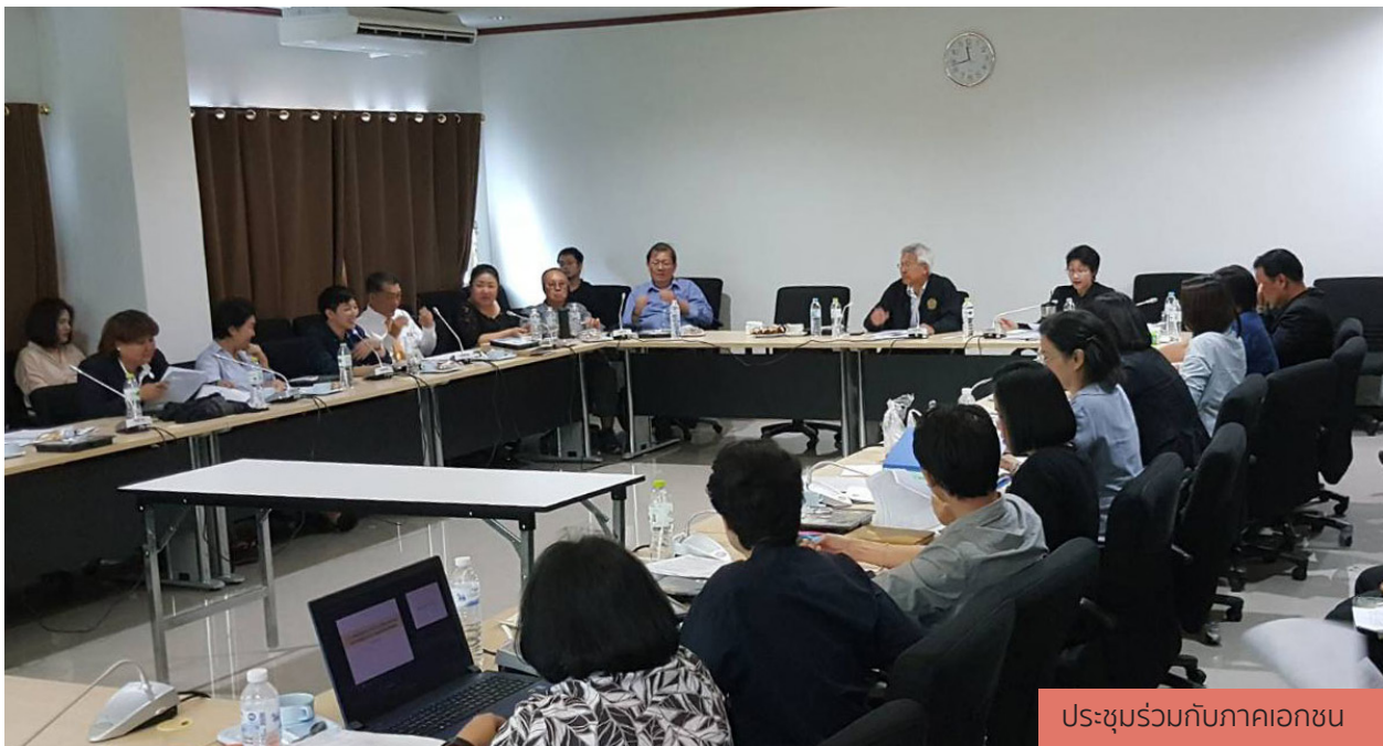
ประชุมร่วมกับภาคเอกชน

เงื่อนไขพิเศษตามข้อตกลงของประเทศผู้นำเข้า เช่น พิธีสารระหว่างกระทรวงเกษตรและสหกรณ์แห่งราชอาณาจักรไทยและกระทรวงควบคุมคุณภาพและตรวจสอบกักกันโรคแห่งสาธารณรัฐประชาชนจีน ว่าด้วยข้อกำหนดด้านการกักกันโรคและตรวจสอบสำหรับสินค้าผลไม้เมืองร้อนที่ส่งออกจากประเทศไทยไปสาธารณรัฐประชาชนจีน ซึ่งกำหนดให้ผลไม้ที่ส่งออกมาสาธารณรัฐประชาชนจีนต้องมาจากโรงบรรจุหีบห่อที่ได้รับการขึ้นทะเบียนจากกระทรวงเกษตรและสหกรณ์เพื่อวัตถุประสงค์ของการตรวจสอบย้อนกลับ