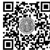
ประกาศ สป.กษ. กำหนดจำนวนคนขึ้นบัญชีฯ