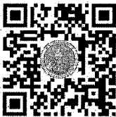
กลุ่มตำแหน่ง

ประธานกรรมการกลับกรองเพื่อพิจารณาผู้ที่สมควรขึ้นบัญชี รายชื่อผู้ผ่านการกลับกรองตำแหน่งประเภทอำนวยการ ของสำนักงานปลัดกระทรวงเกษตรและสหกรณ์