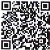
QR CODE @1784 DDPM