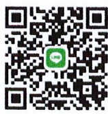
QR CODE DPMNPT