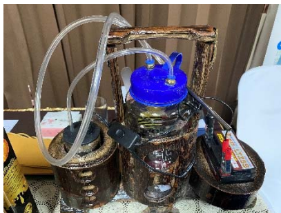
เครื่องดูดน้ำฝิ่งชั้นโรงที่มีถั่วขนาดใหญ่

- หลังจากเก็บน้ำฝิ่งชั้นโรงแล้ว ควรมีการบ่มน้ำฝิ่งเพื่อแยกสิ่งแปลกปลอมออกจากน้ำฝิ่ง