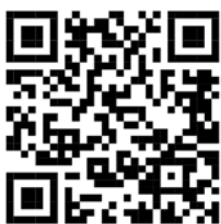
ลูกประคบสมุนไพร

สื่อการสอน : https://youtu.be/z8-n3G4z4T0