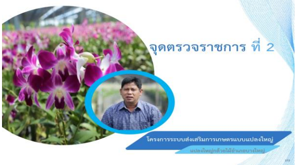
จุดตรวจราชการ ที่ 2