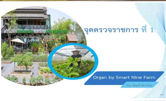
จุดตรวจราชการ ที่ 1