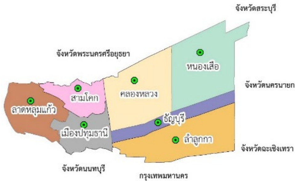
ภาพที่ 1 แผนที่และขอบเขตจังหวัดปทุมธานี