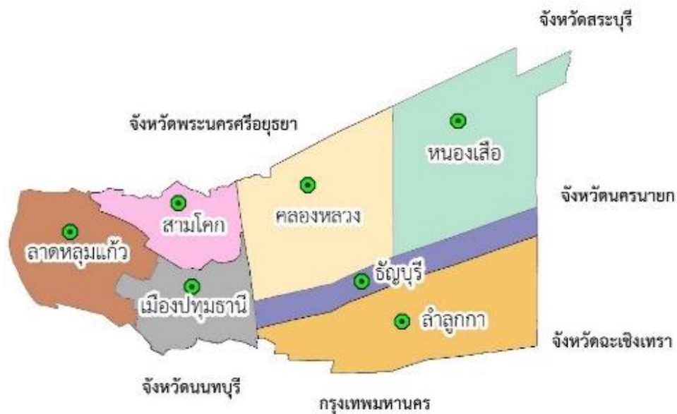
ภาพที่ 1 แผนที่และขอบเขตจังหวัดปทุมธานี