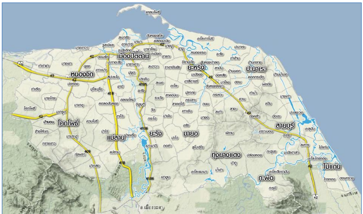
รูปภาพ ๑ แผนที่จังหวัดปัตตานี

ทิศตะวันตก ติดต่อกับ เขตอำเภอเทพา และอำเภอสะบ้าย้อย จังหวัดสงขลา