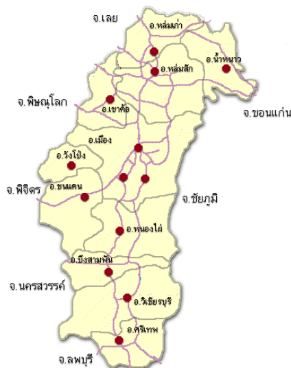
ภาพที่ ๑ อาณาเขตติดต่อกับจังหวัดใกล้เคียง

ทิศตะวันตก ติดต่อกับ จังหวัดพิษณุโลก จังหวัดนครสวรรค์ และจังหวัดพิจิตร