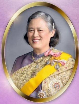
ทรงพระเจริญ