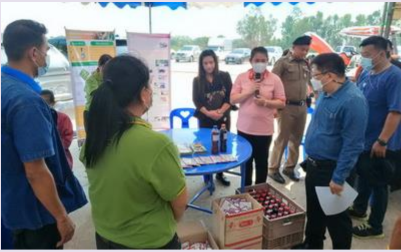
วันที่ 18 พฤษภาคม 2566 สถานีพัฒนาที่ดินพิจิตร ออกหน่วยบริการ วันถ่ายทอดเทคโนโลยี เพื่อเริ่มต้นฤดูกาลผลิตใหม่(Field Day) ประจำปีงบประมาณ 2566 ณ ศูนย์จัดการดินปุ๋ยชุมชนตำบลบางไผ่ (ศดปช.) หมู่ที่ 7 ตำบลบางไผ่ อำเภอบางมูลนาก จังหวัดพิจิตร