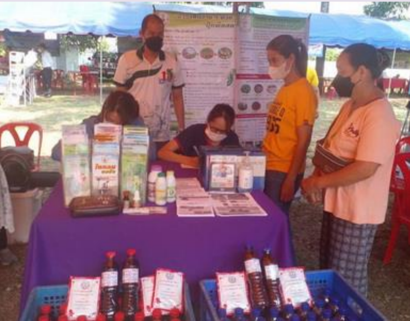
วันที่ 18 พฤษภาคม 2566 สถานีพัฒนาที่ดินพิจิตรออกหน่วยบริการ โครงการบำบัดทุกข์ บำรุงสุข สร้างรอยยิ้มให้ชาวพิจิตร ประจำปีงบประมาณ 2566 ณ วัดหนองตะเคียน หมู่ที่ 1 ตำบลคลองทราย อำเภอสากเหล็ก จังหวัดพิจิตร