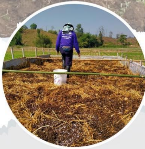
ผลิตปุ๋ย

เป็นการเพิ่มอินทรีย์วัตถุให้กับดิน และหมุนเวียนธาตุอาหารคืนสู่ดิน