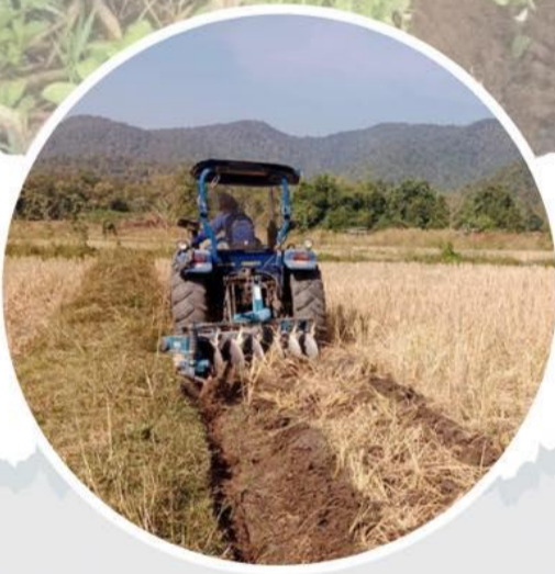
โถกลอบตอซัง

เป็นการเพิ่มอินทรีย์วัตถุให้กับดิน และหมุนเวียนธาตุอาหารคืนสู่ดิน