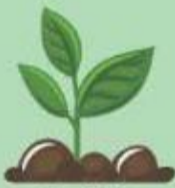
พันธุ์พืช