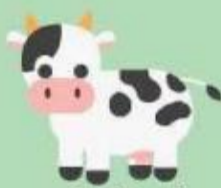
พันธุ์สัตว์