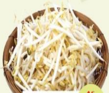
ถั่วงอก 15 วัน