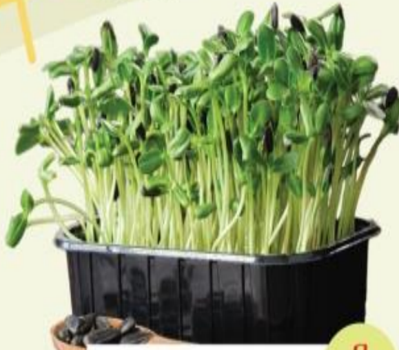
ต้นอ่อนทานตะวัน 7 วัน

เพาะง่าย ไม่ต้องใช้ปุ๋ย สารพัดคุณประโยชน์ทำได้หลากหลายเมนู