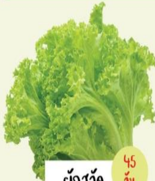
ผักสลัด 45 วัน

ปลูกง่าย จะปลูกในดิน หรือกระถางก็ได้ เสริมสร้างภูมิคุ้มกัน