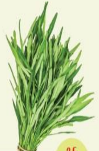
ผักบุ้งจีน 25 วัน

เพาะง่าย ไม่ต้องใช้ปุ๋ย สารพัดคุณประโยชน์ทำได้หลากหลายเมนู