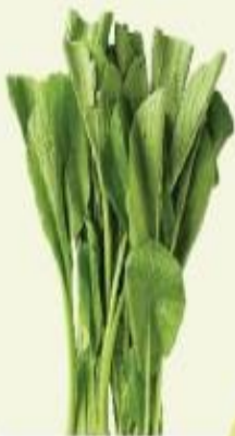
กวาดตุ้ง 30 วัน

มีวิตามิน A บำรุงสายตา มีสารต้านอนุมูลอิสระช่วยชะลอวัย