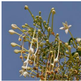
ต้นปีป ต้นไม้ประจำจังหวัด