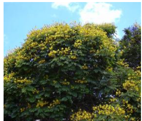
ดอกนมนत्री ดอกไม้ประจำจังหวัด